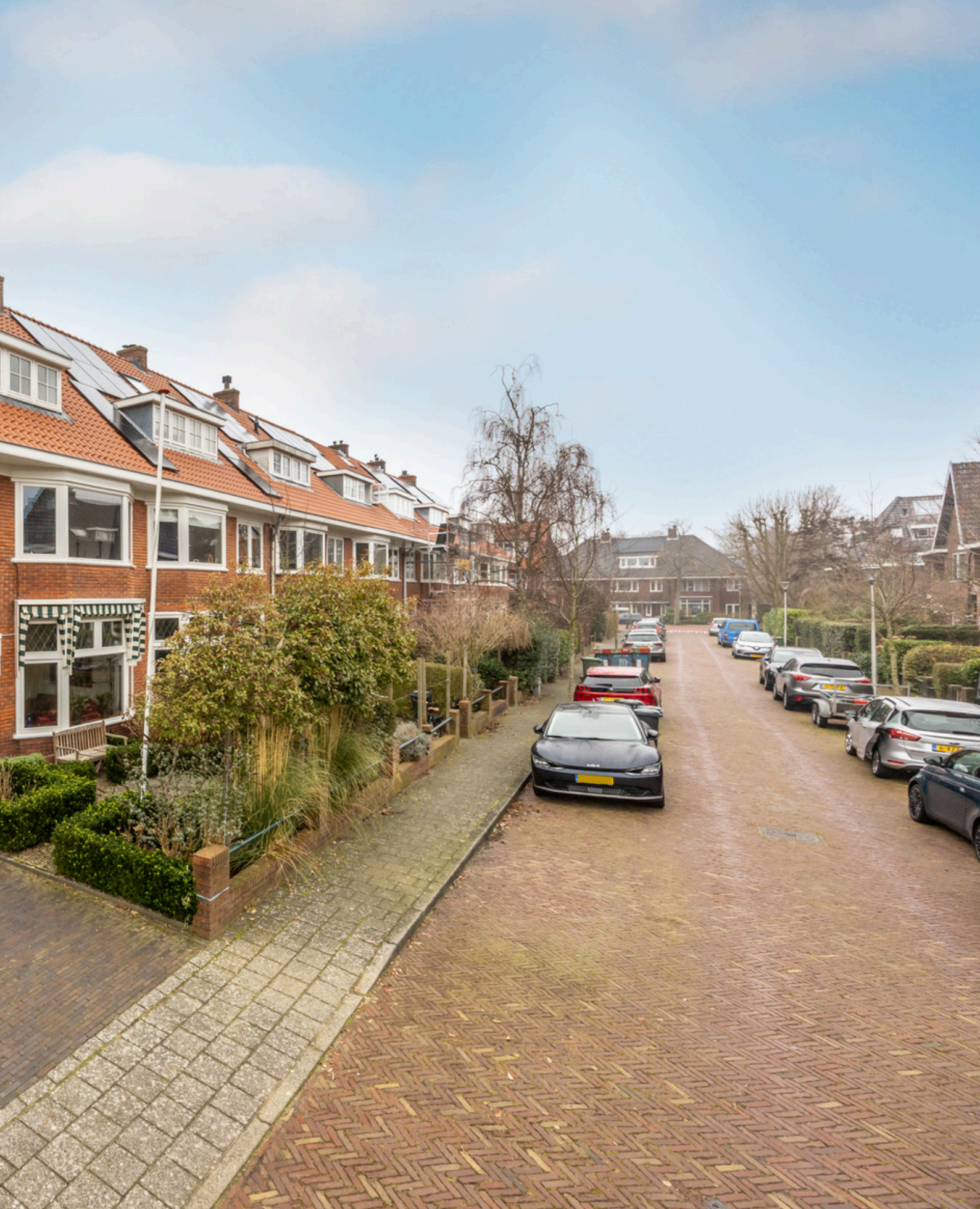
Jacob de Witstraat 5, Heemstede