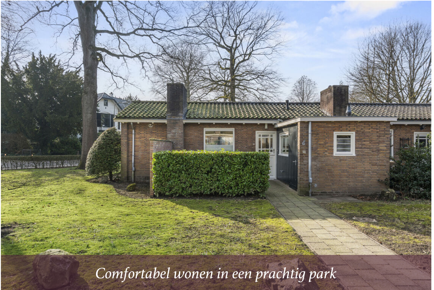
Comfortabel wonen in een prachtig park