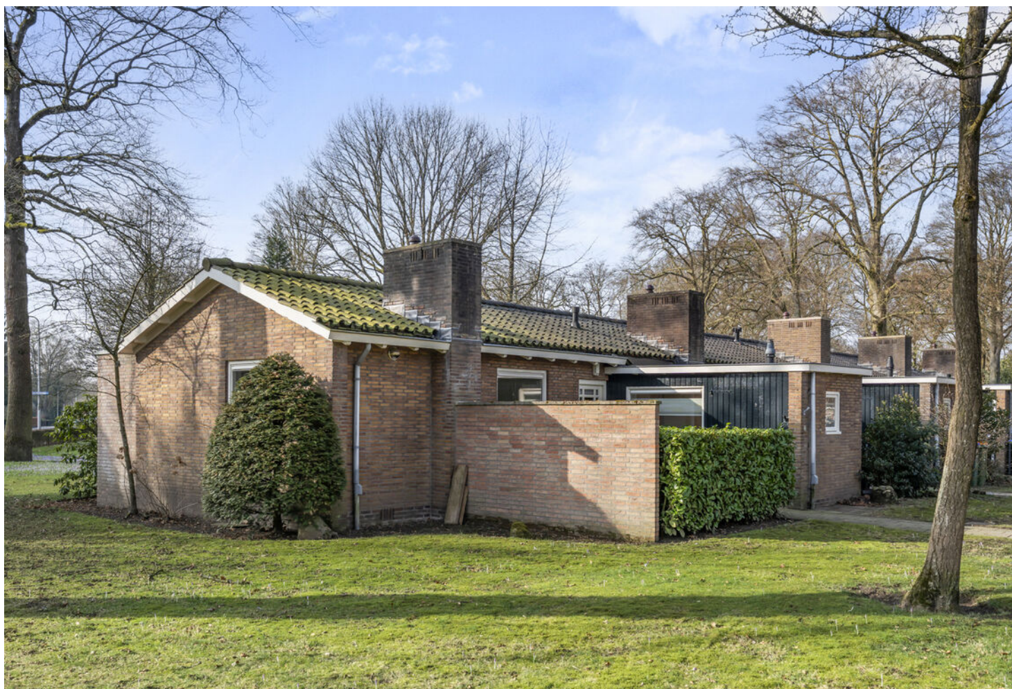
Ericapark 33 Bennekom