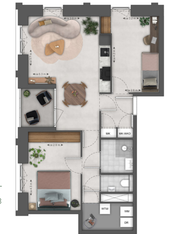
APPARTEMENT TYPE B3