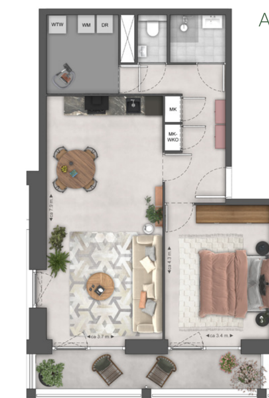
APPARTEMENT TYPE B4

Vanuit elk appartement heb je verrassend groen uitzicht.