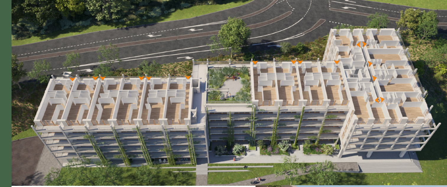
VERDIEPINGSOVERZICHT 5E ETAGE MET DAKTUIN