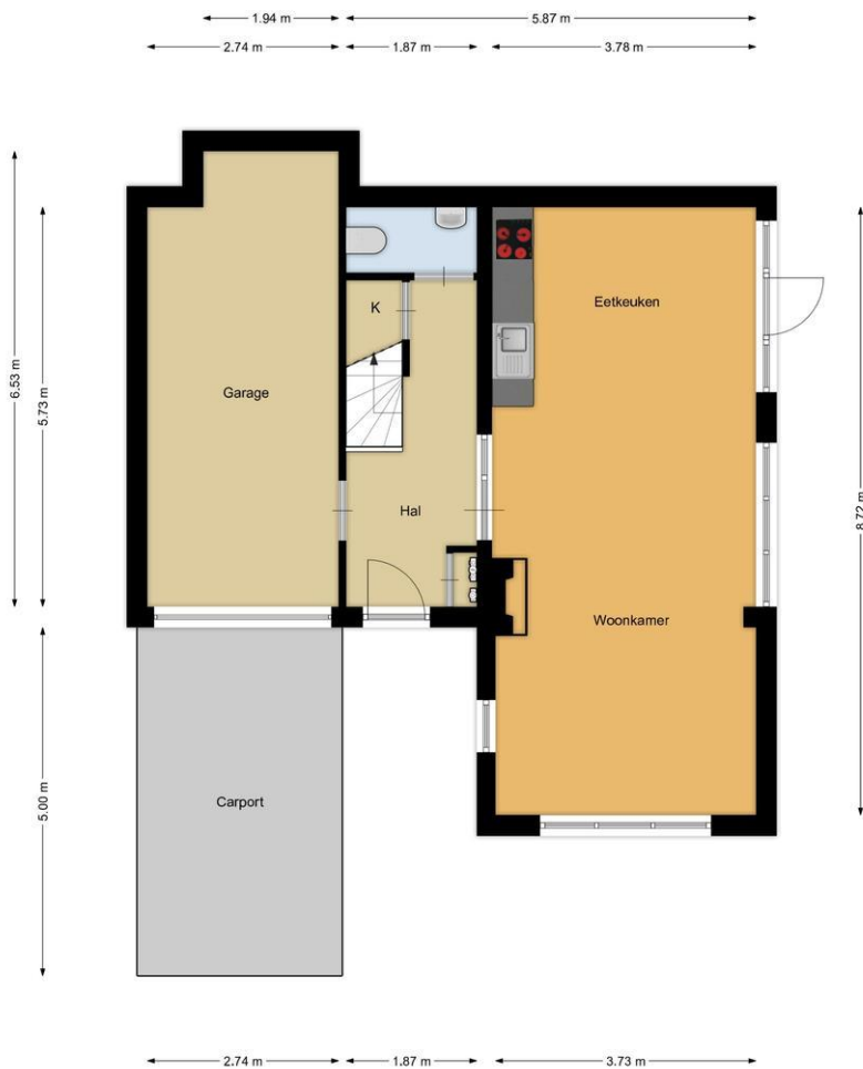
De Maten 7, Blaricum Begane grond

De plattegronden zijn geproduceerd voor promotionele doeleinden en ter indicatie. Aan de plattegronden kunnen geen rechten worden ontleend.