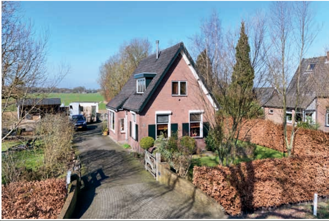
Loenen Voorsterweg 105