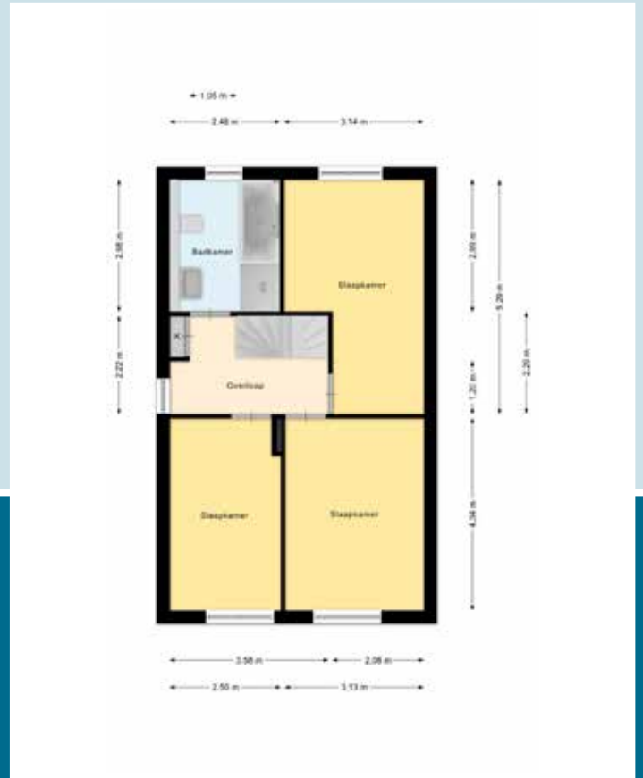
Indeling 1 ste verdieping