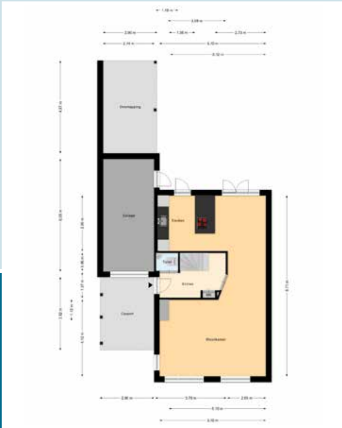
Indeling begane grond