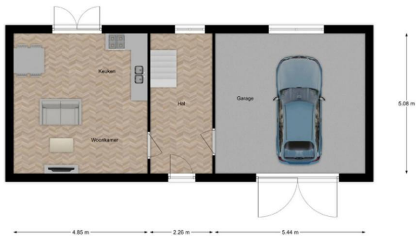
Bijgebouw Begane Grond