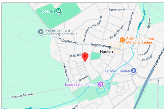
noorden kadastrale kaart