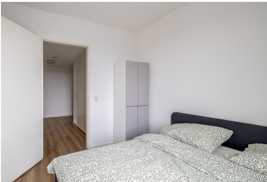
Graaf Janstraat 20A, Beverwijk