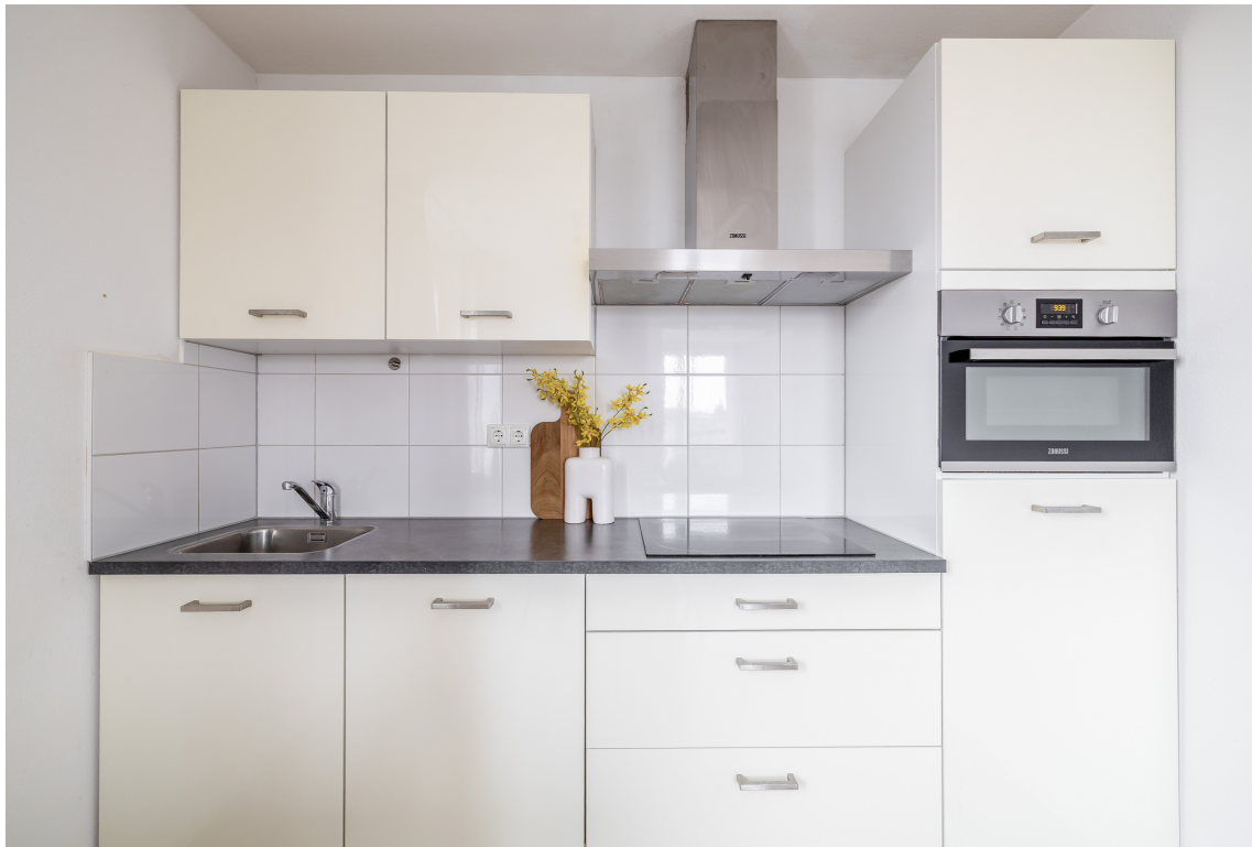
Graaf Janstraat 20A, Beverwijk