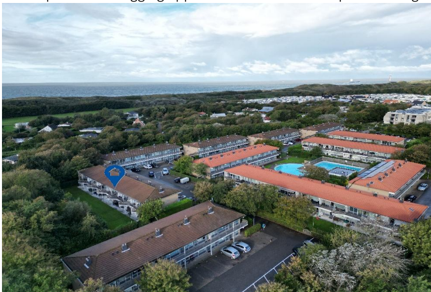
Luchtopname met de unieke ligging van het appartement.