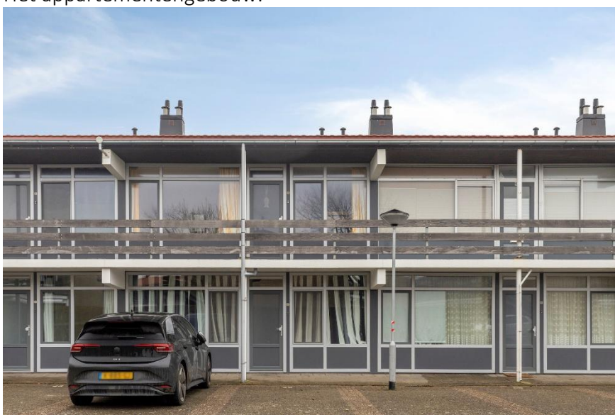
Het appartementengebouw met parkeerplaats.