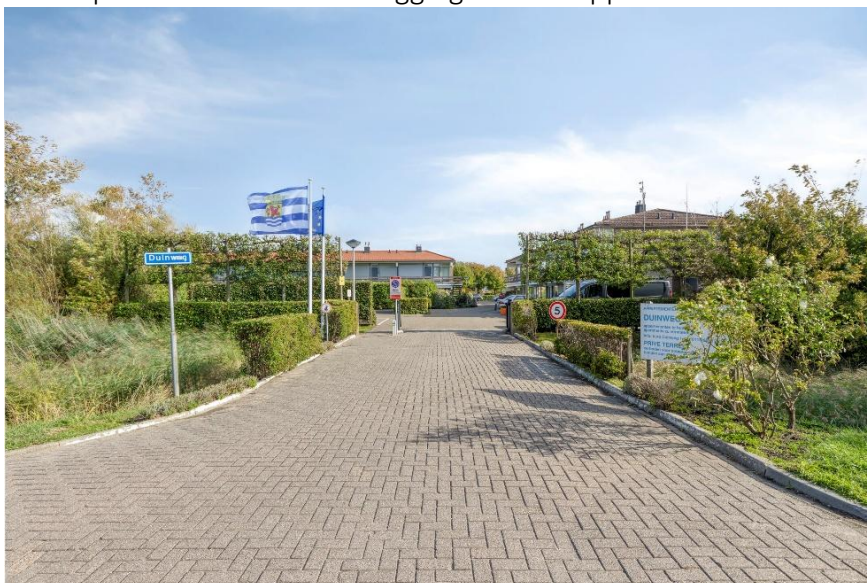
Binnenkomst in het appartementencomplex Duinweg met een afsluitbaar hekwerk.

Verkoopbrochure: Duinweg 48 Westkapelle Deze informatie is geheel vrijblijvend, uitsluitend bestemd voor geadresseerde en niet bedoeld als een aanbod. Ten aanzien van de juistheid kan door Makelaarskantoor Roose geen aansprakelijkheid worden aanvaard, noch kan aan de vermelde informatie enig recht worden ontleend.