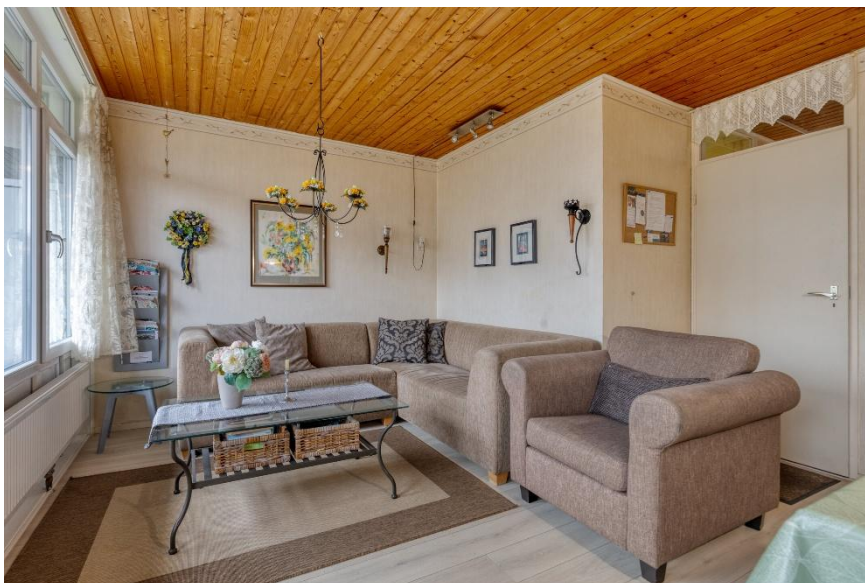
De lichte woonkamer.

Verkoopbrochure: Duinweg 48 Westkapelle Deze informatie is geheel vrijblijvend, uitsluitend bestemd voor geadresseerde en niet bedoeld als een aanbod. Ten aanzien van de juistheid kan door Makelaarskantoor Roose geen aansprakelijkheid worden aanvaard, noch kan aan de vermelde informatie enig recht worden ontleend.