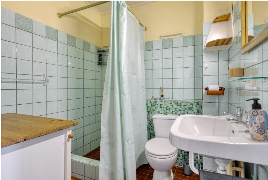
De badkamer met wastafel, toilet en inloopdouche.