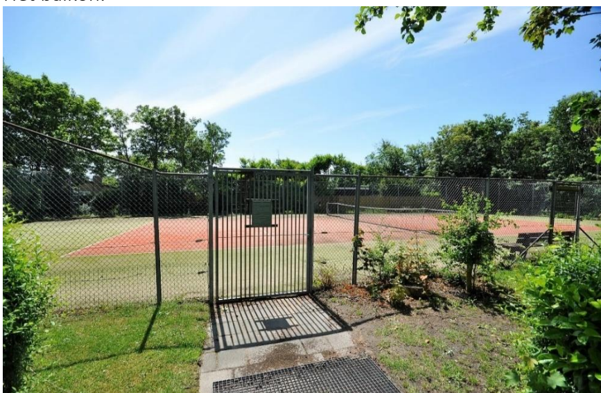
Tennisbaan op het appartementencomplex.

Verkoopbrochure: Duinweg 48 Westkapelle Deze informatie is geheel vrijblijvend, uitsluitend bestemd voor geadresseerde en niet bedoeld als een aanbod. Ten aanzien van de juistheid kan door Makelaarskantoor Roose geen aansprakelijkheid worden aanvaard, noch kan aan de vermelde informatie enig recht worden ontleend.