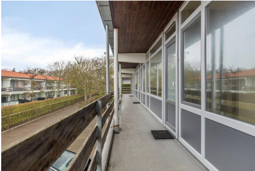
Toegang tot de entree.