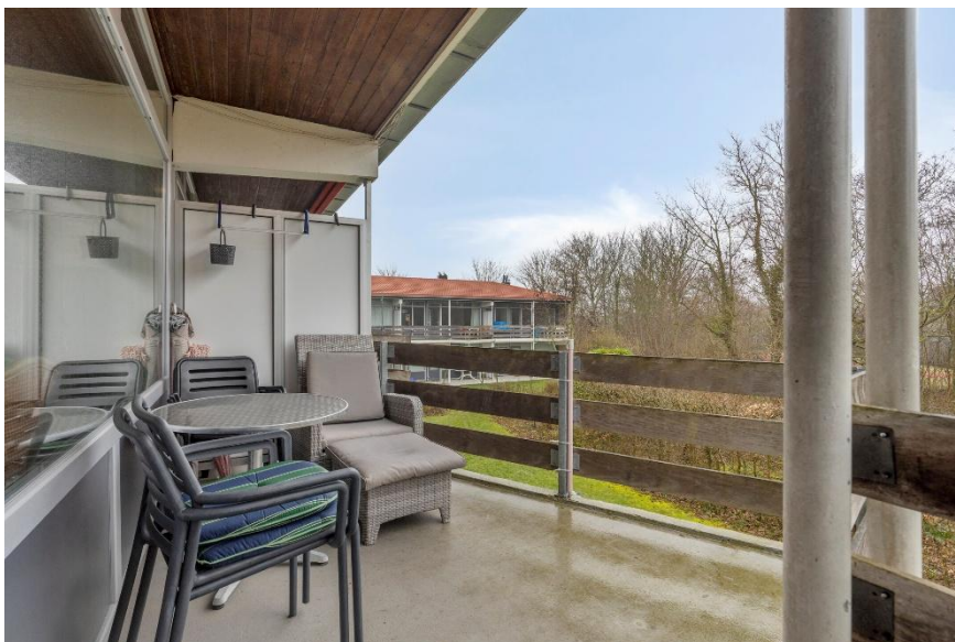
Toegang naar het balkon (zuidoosten) vanuit de woonkamer.

Verkoopbrochure: Duinweg 48 Westkapelle Deze informatie is geheel vrijblijvend, uitsluitend bestemd voor geadresseerde en niet bedoeld als een aanbod. Ten aanzien van de juistheid kan door Makelaarskantoor Roose geen aansprakelijkheid worden aanvaard, noch kan aan de vermelde informatie enig recht worden ontleend.