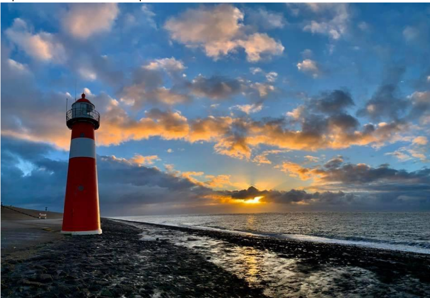
Op loopafstand van dit prachtige uitzicht.