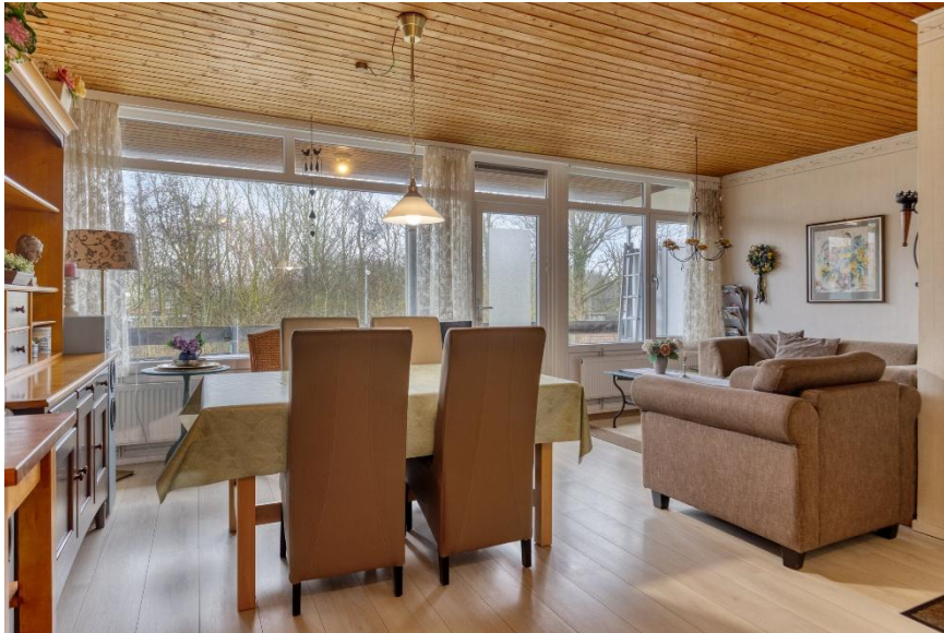
De woonkamer-eethoek met deur naar het balkon.