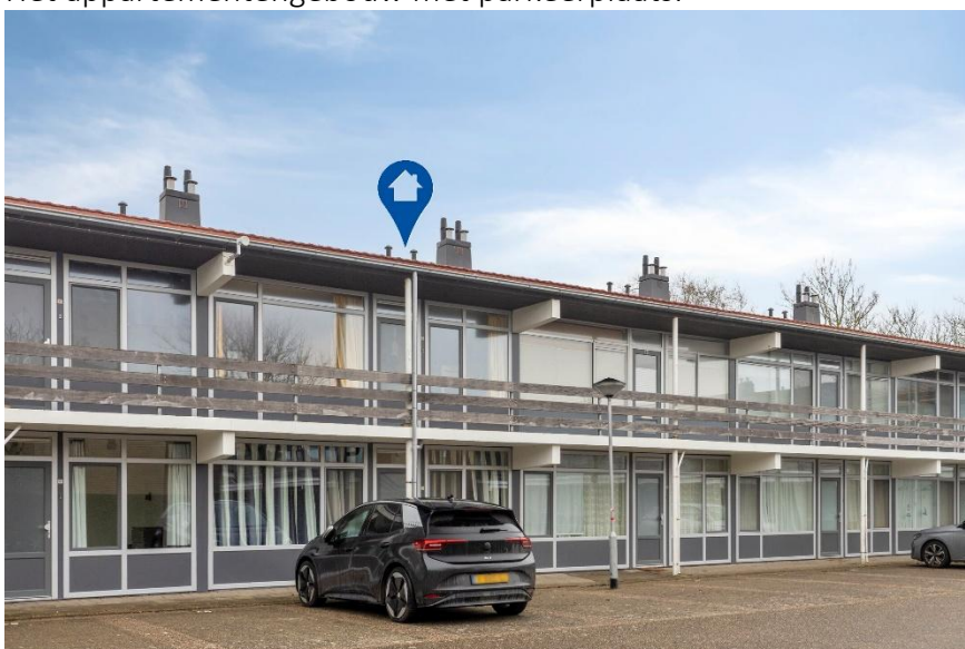
Vooranzicht van het appartementengebouw.

Verkoopbrochure: Duinweg 48 Westkapelle Deze informatie is geheel vrijblijvend, uitsluitend bestemd voor geadresseerde en niet bedoeld als een aanbod. Ten aanzien van de juistheid kan door Makelaarskantoor Roose geen aansprakelijkheid worden aanvaard, noch kan aan de vermelde informatie enig recht worden ontleend.