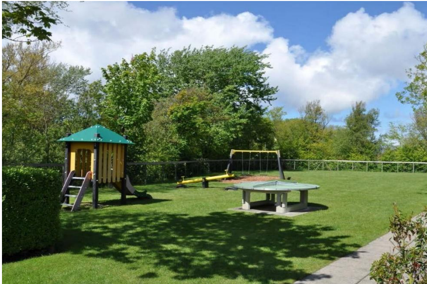
Speeltuin voor kinderen dichtbij het appartement.