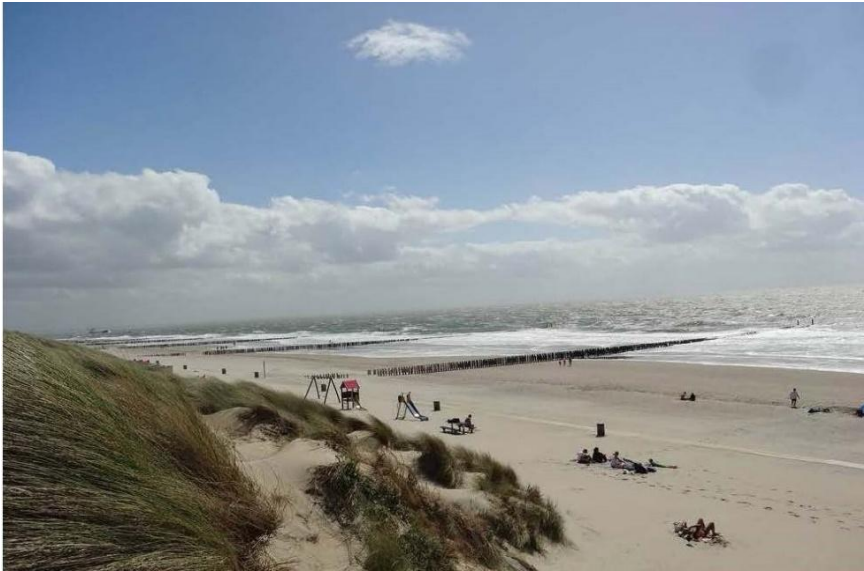
Op enkele minuten lopen van het strand.