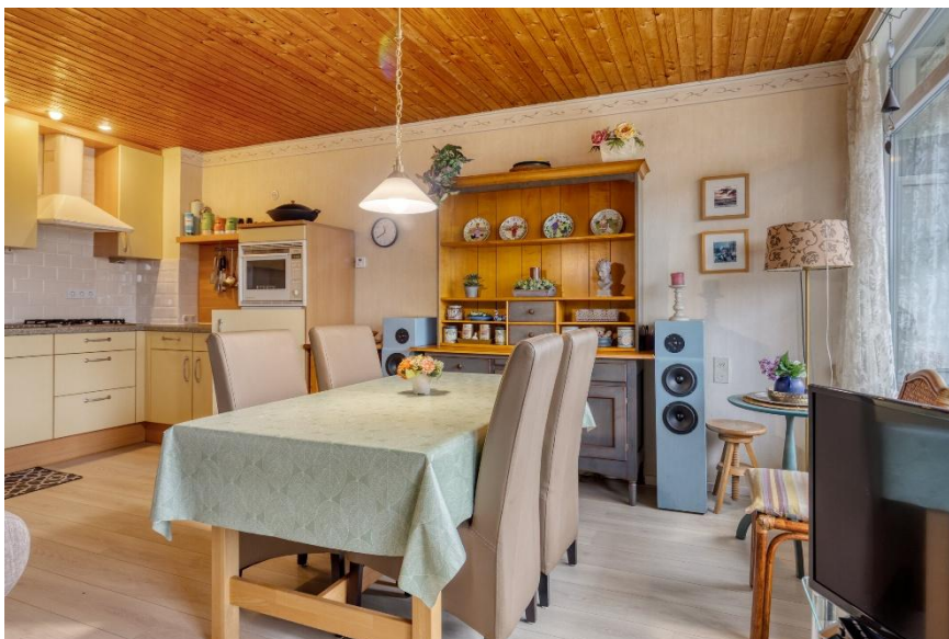
De eethoek-keuken aanzicht.

Verkoopbrochure: Duinweg 48 Westkapelle Deze informatie is geheel vrijblijvend, uitsluitend bestemd voor geadresseerde en niet bedoeld als een aanbod. Ten aanzien van de juistheid kan door Makelaarskantoor Roose geen aansprakelijkheid worden aanvaard, noch kan aan de vermelde informatie enig recht worden ontleend.