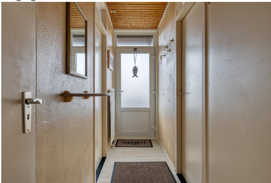
Welkom in de entree.