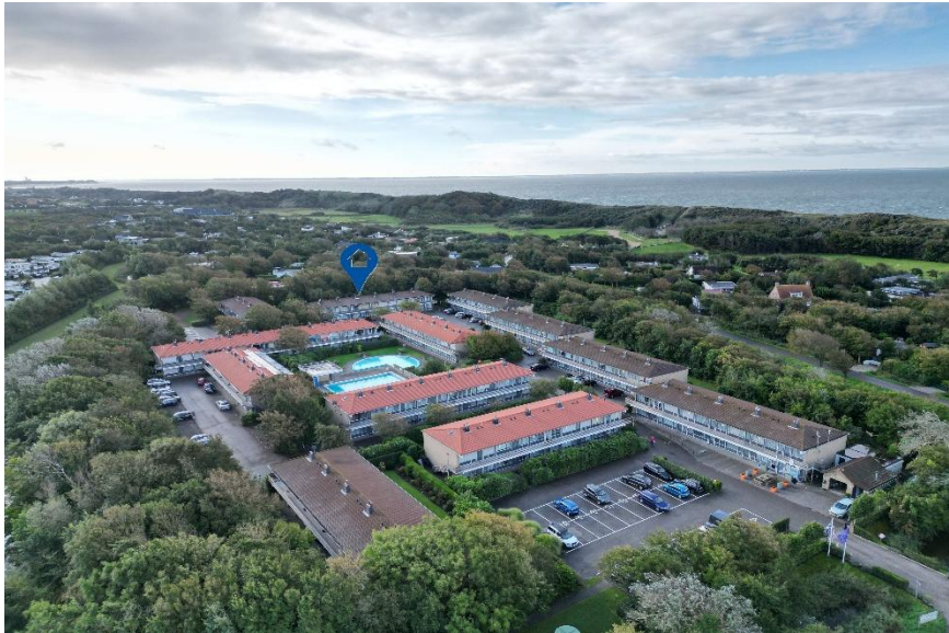
Luchtopname met ligging appartement met de zee op de achtergrond!