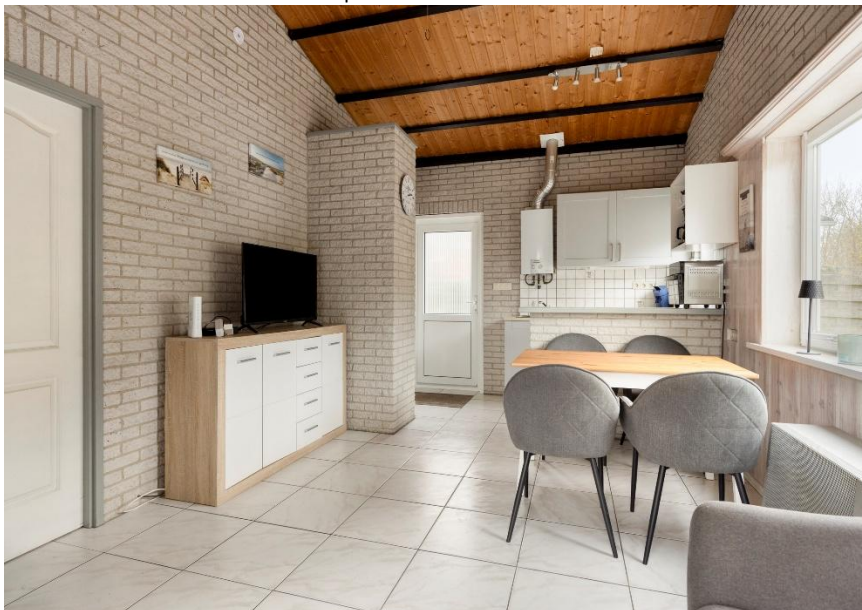
Woonkamer met eethoek en keuken aanzicht.

Verkoopbrochure: de Zandput 10 te Zoutelande. Deze informatie is geheel vrijblijvend, uitsluitend bestemd voor geadresseerde en niet bedoeld als een aanbod. Ten aanzien van de juistheid kan door Makelaarskantoor Roose geen aansprakelijkheid worden aanvaard, noch kan aan de vermelde informatie enig recht worden ontleend.