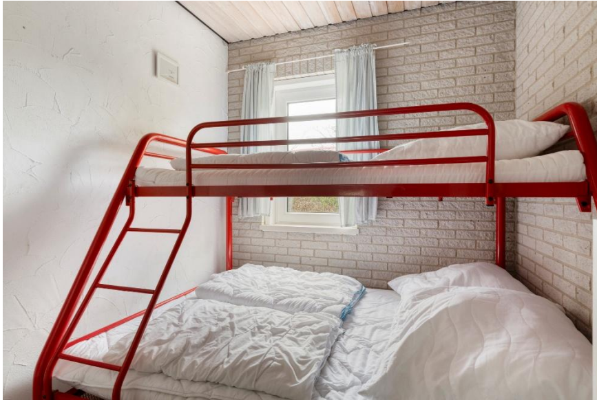
Slaapkamer 2 met een vlizotrap naar een bergzolder.