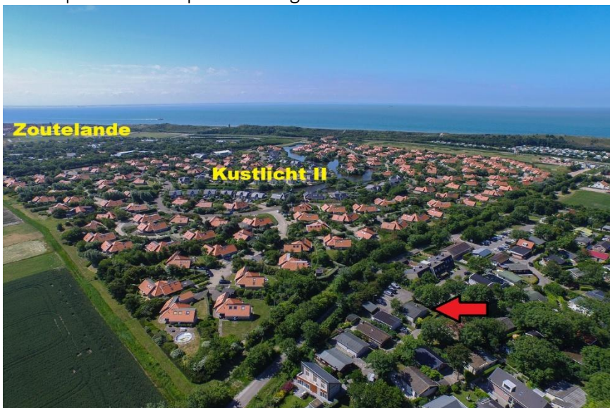
Luchtopname met ligging object.