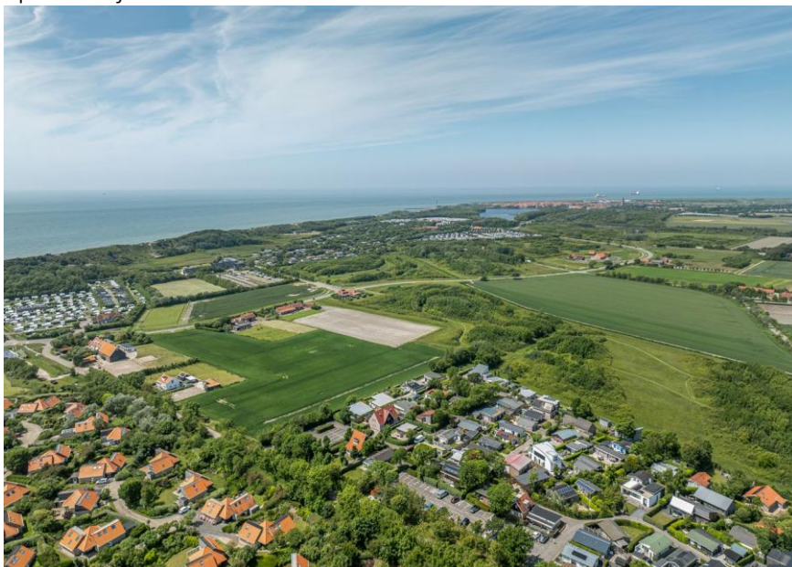
Luchtopname met rechts onder het parkje.

Verkoopbrochure: de Zandput 10 te Zoutelande. Deze informatie is geheel vrijblijvend, uitsluitend bestemd voor geadresseerde en niet bedoeld als een aanbod. Ten aanzien van de juistheid kan door Makelaarskantoor Roose geen aansprakelijkheid worden aanvaard, noch kan aan de vermelde informatie enig recht worden ontleend.