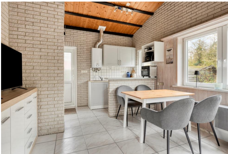
De eethoek en keuken.