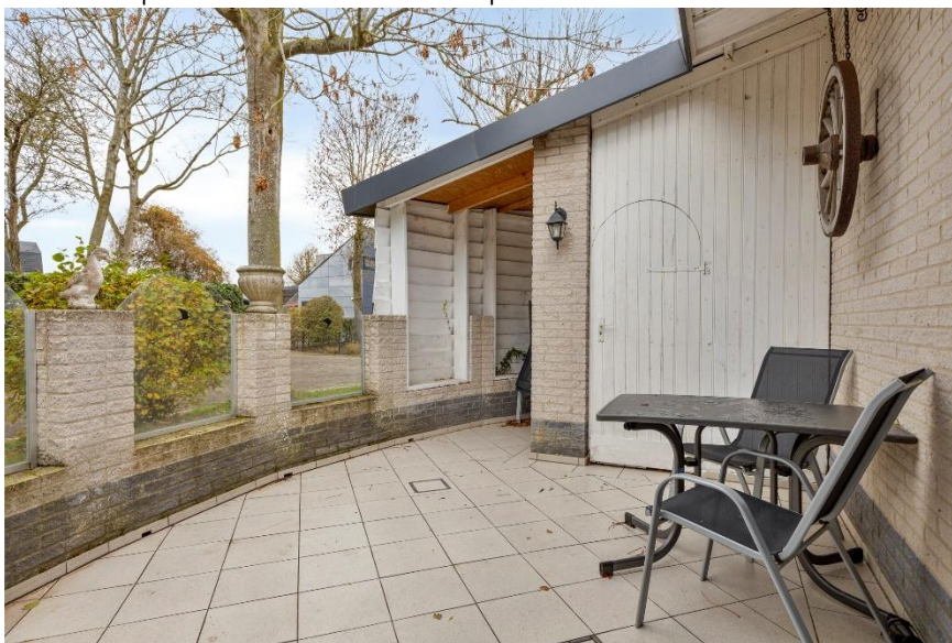
Het omsloten terras met lage pilaren en daartussen beglazing, en de aangebouwde berging.

Verkoopbrochure: de Zandput 10 te Zoutelande. Deze informatie is geheel vrijblijvend, uitsluitend bestemd voor geadresseerde en niet bedoeld als een aanbod. Ten aanzien van de juistheid kan door Makelaarskantoor Roose geen aansprakelijkheid worden aanvaard, noch kan aan de vermelde informatie enig recht worden ontleend.