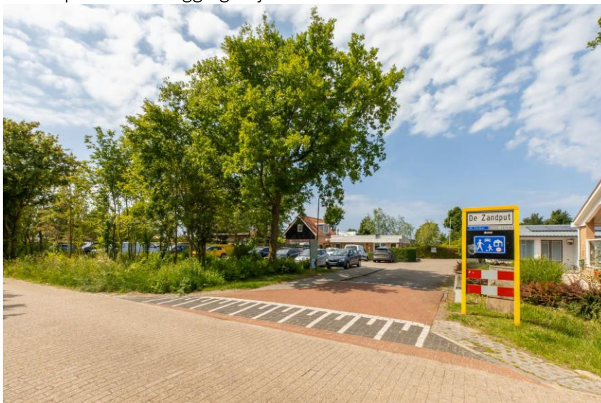
Toegang tot het vakantieparkje de Zandput.

Verkoopbrochure: de Zandput 10 te Zoutelande. Deze informatie is geheel vrijblijvend, uitsluitend bestemd voor geadresseerde en niet bedoeld als een aanbod. Ten aanzien van de juistheid kan door Makelaarskantoor Roose geen aansprakelijkheid worden aanvaard, noch kan aan de vermelde informatie enig recht worden ontleend.