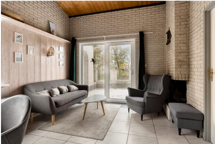
De woonkamer met openhaard.