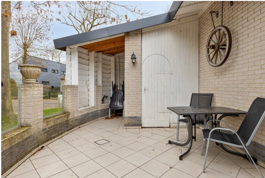
Het omsloten terras op het westen.