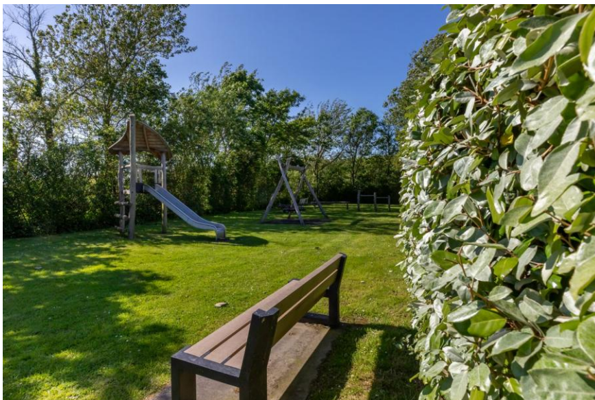
Op enkele meters lopen is er een speelveldje voor de kleine kinderen.