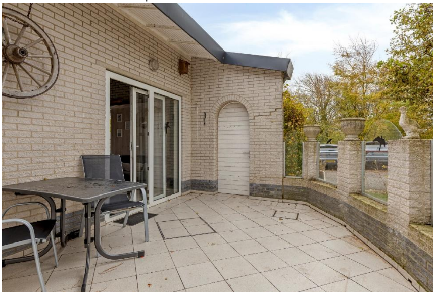
Het terras met deur naar de straat.