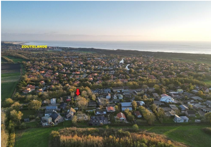
Luchtopname met op de achtergrond het strand en de zee.