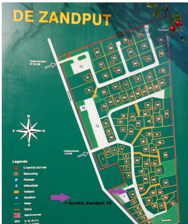
Locatie in de Zandput.

Verkoopbrochure: de Zandput 10 te Zoutelande. Deze informatie is geheel vrijblijvend, uitsluitend bestemd voor geadresseerde en niet bedoeld als een aanbod. Ten aanzien van de juistheid kan door Makelaarskantoor Roose geen aansprakelijkheid worden aanvaard, noch kan aan de vermelde informatie enig recht worden ontleend.