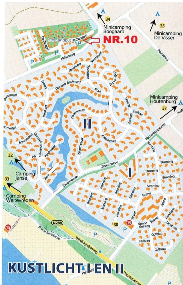
Ligging t.o.v. vakantiepark Kustlicht I en II.