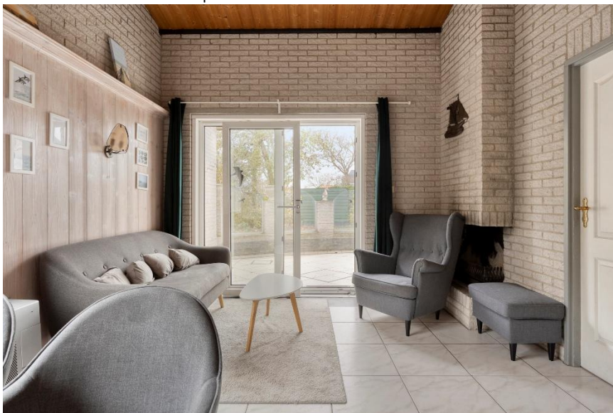
De woonkamer met schuifpui naar het terras.