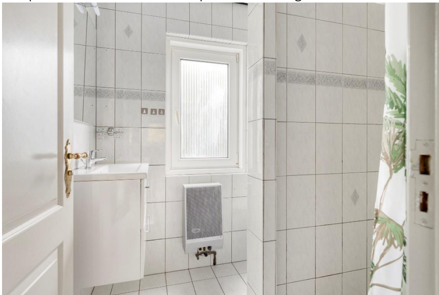
De badkamer met inloopdouche, wastafel en toilet.