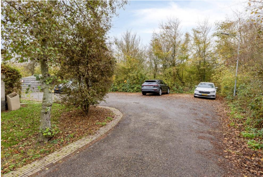
Parkeren naast de woning.