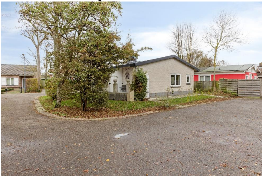
Zicht op de woning.