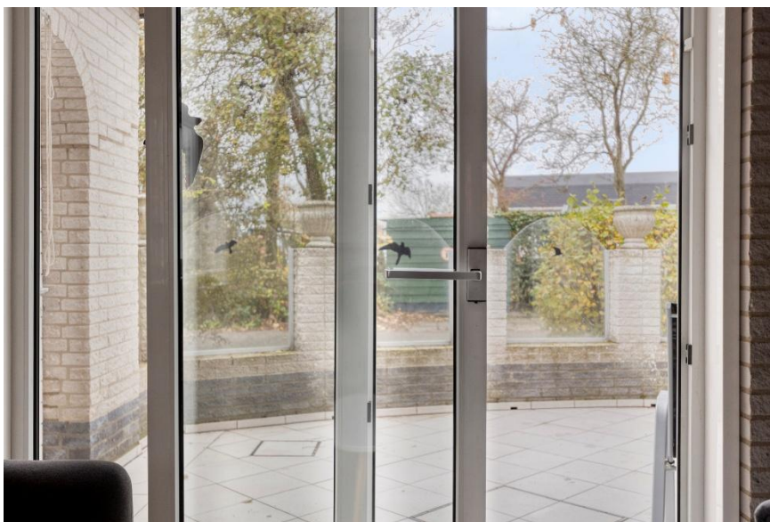
Uitzicht op het terras via de schuifpui.