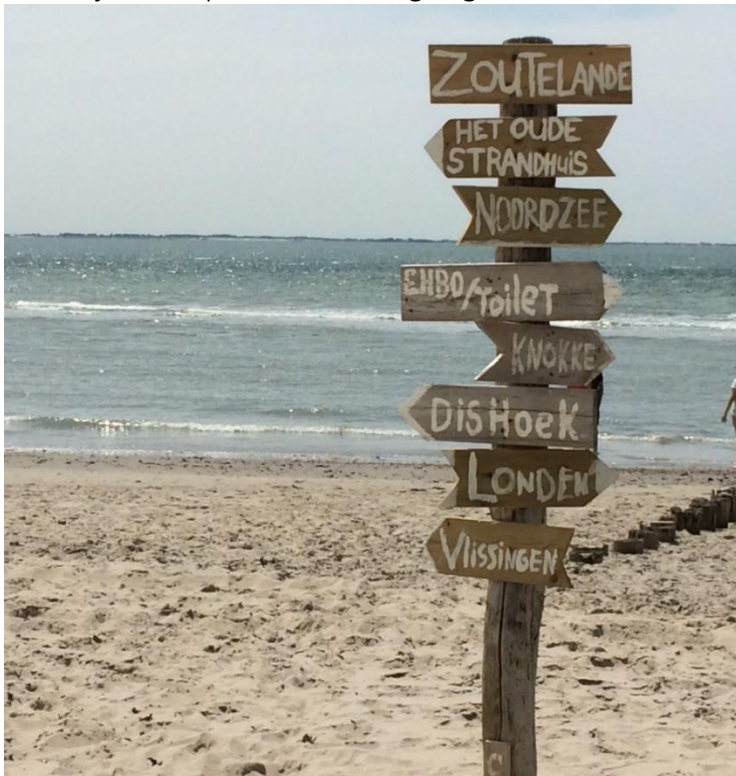
Op enkele minuten lopen van het strand.

Verkoopbrochure: de Zandput 10 te Zoutelande. Deze informatie is geheel vrijblijvend, uitsluitend bestemd voor geadresseerde en niet bedoeld als een aanbod. Ten aanzien van de juistheid kan door Makelaarskantoor Roose geen aansprakelijkheid worden aanvaard, noch kan aan de vermelde informatie enig recht worden ontleend.