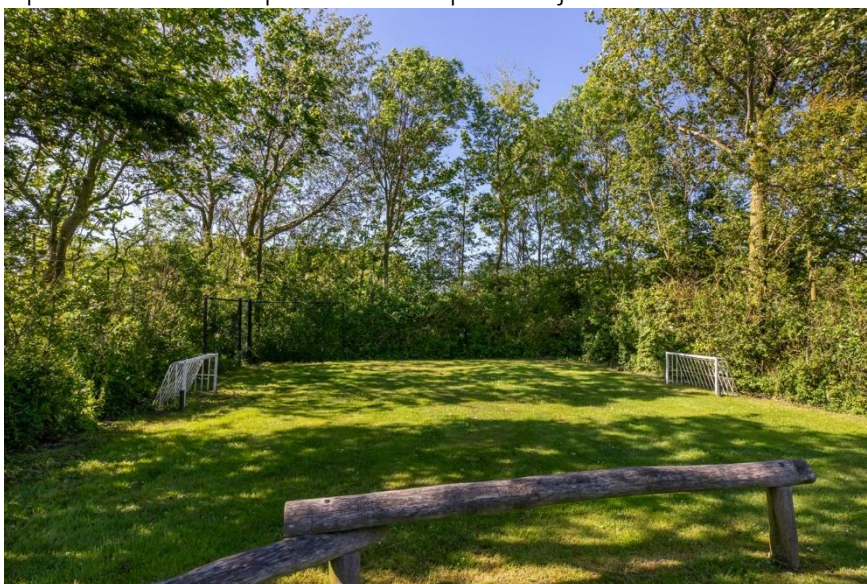
Speelveldje voor de kinderen.