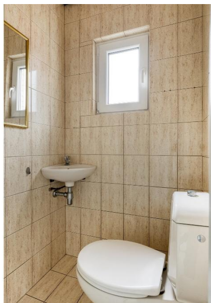
De entree en toilet aanzicht.