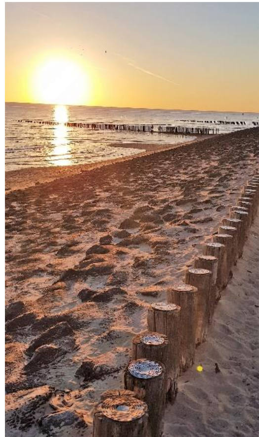
Dichtbij het dorp en het strand gelegen.