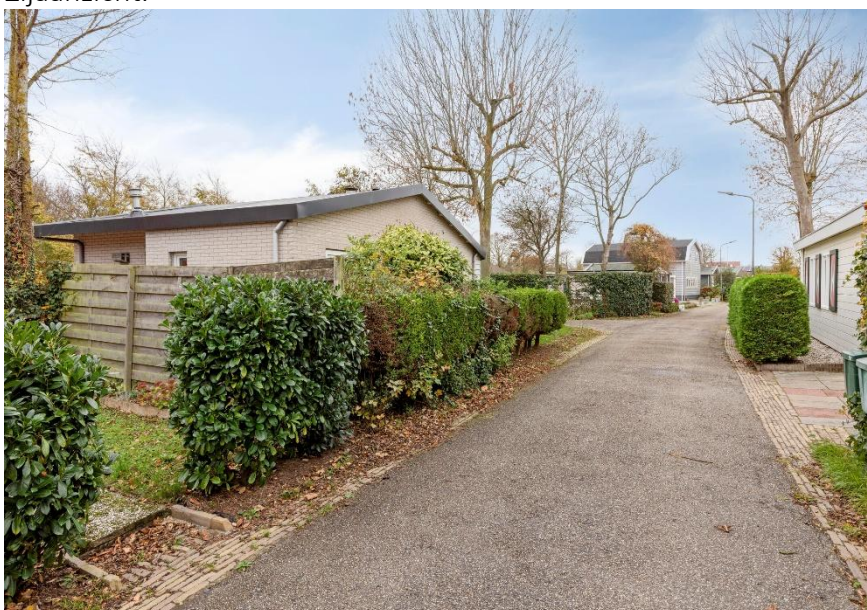
Straatbeeld met links de woning.

Verkoopbrochure: de Zandput 10 te Zoutelande. Deze informatie is geheel vrijblijvend, uitsluitend bestemd voor geadresseerde en niet bedoeld als een aanbod. Ten aanzien van de juistheid kan door Makelaarskantoor Roose geen aansprakelijkheid worden aanvaard, noch kan aan de vermelde informatie enig recht worden ontleend.