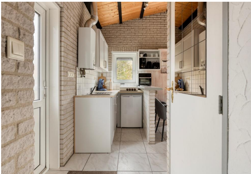
Welkom in de entree.