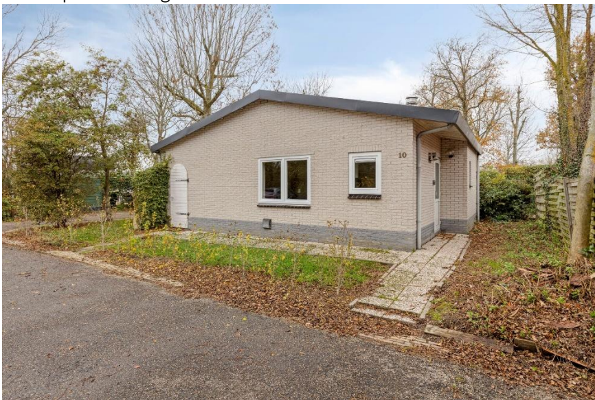
Toegang naar de woning.

Verkoopbrochure: de Zandput 10 te Zoutelande. Deze informatie is geheel vrijblijvend, uitsluitend bestemd voor geadresseerde en niet bedoeld als een aanbod. Ten aanzien van de juistheid kan door Makelaarskantoor Roose geen aansprakelijkheid worden aanvaard, noch kan aan de vermelde informatie enig recht worden ontleend.