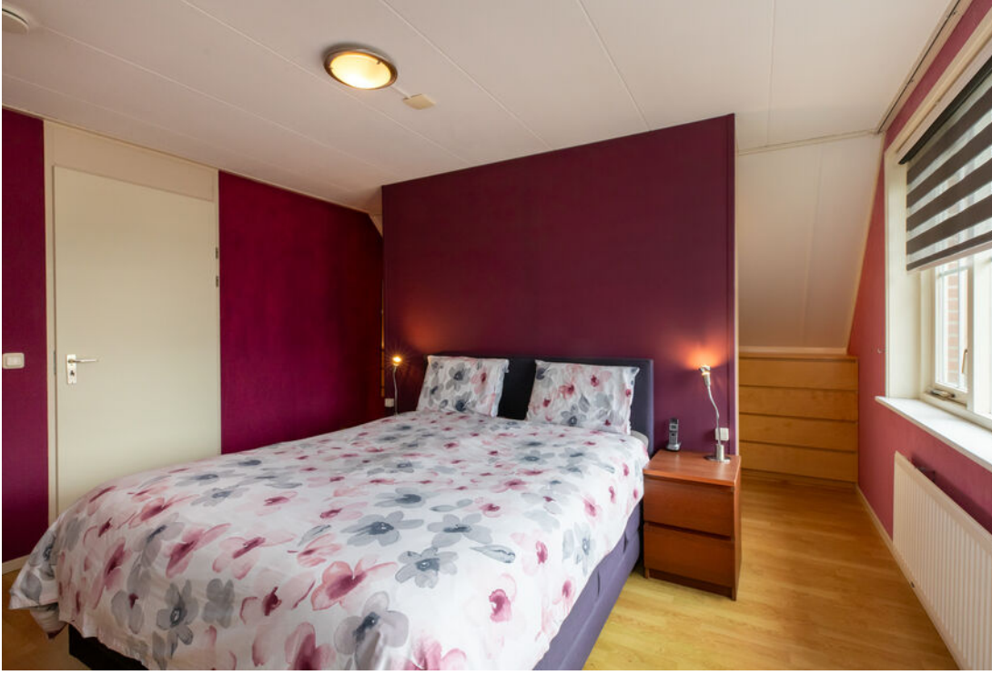
DE SPAIER 10 | ZOUTELANDE