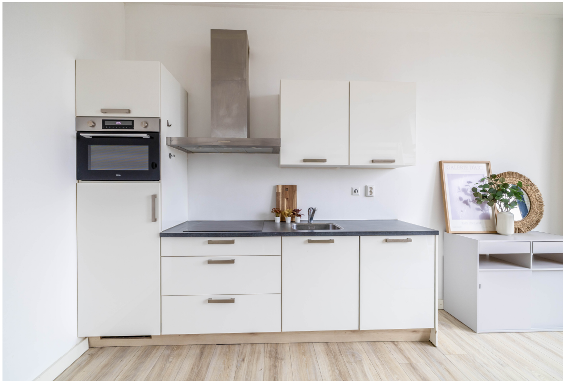
Teylersplein 2C7, Nieuwveen