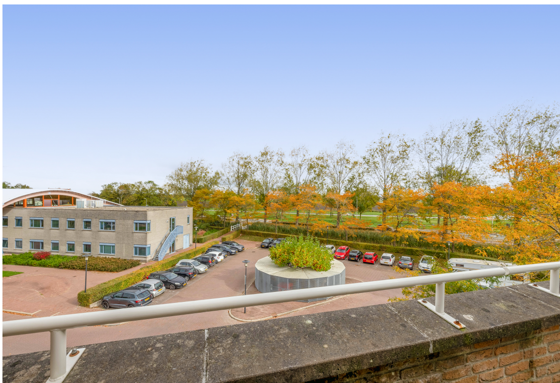
Teylersplein 2C7, Nieuwveen