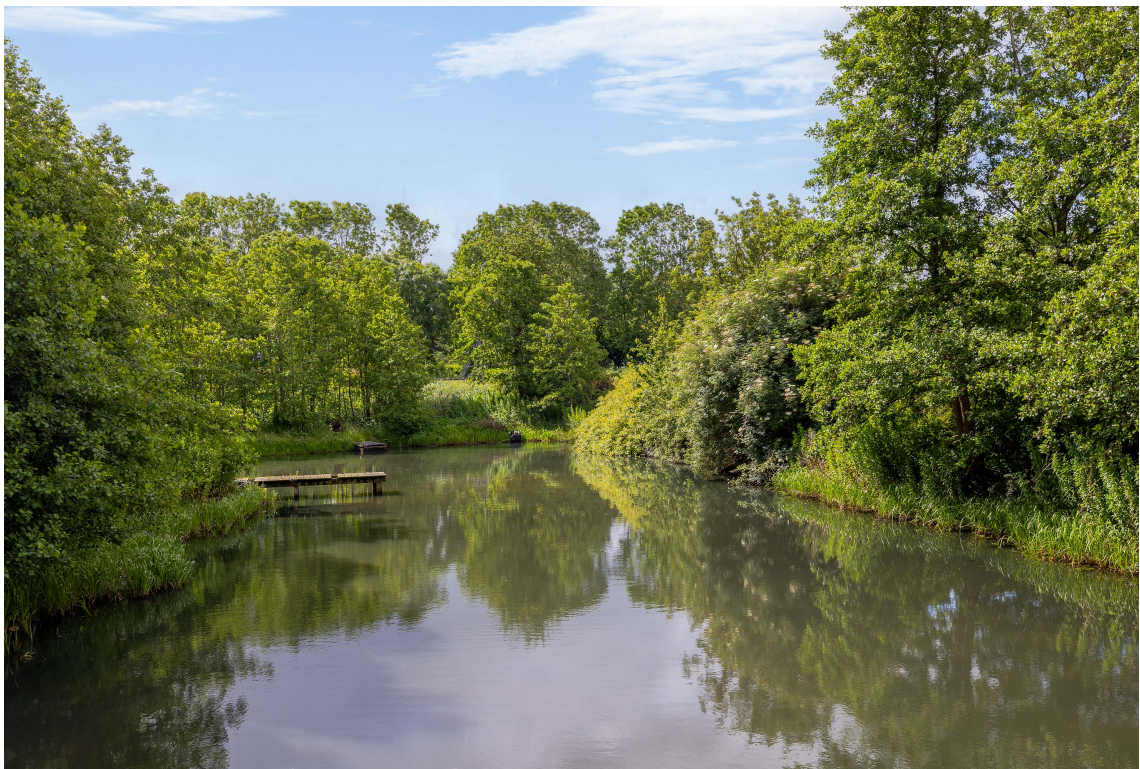
Teylersplein 2C7, Nieuwveen