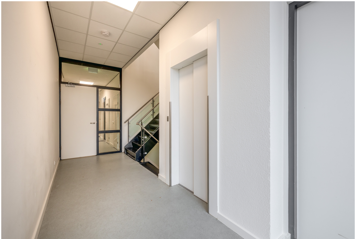
Teylersplein 2C7, Nieuwveen