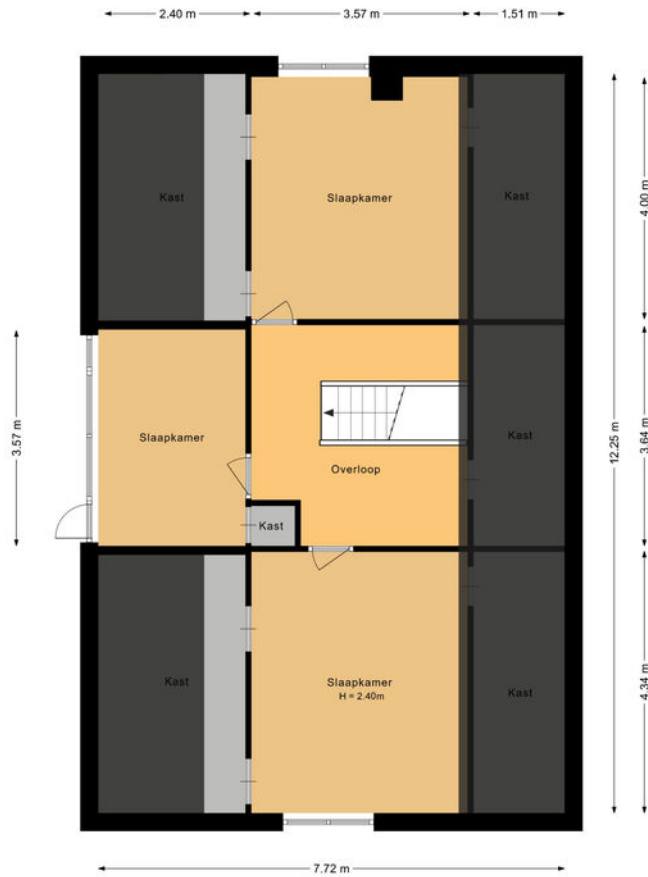
Eerste verdieping Noord-Lierweg 18 De Lier