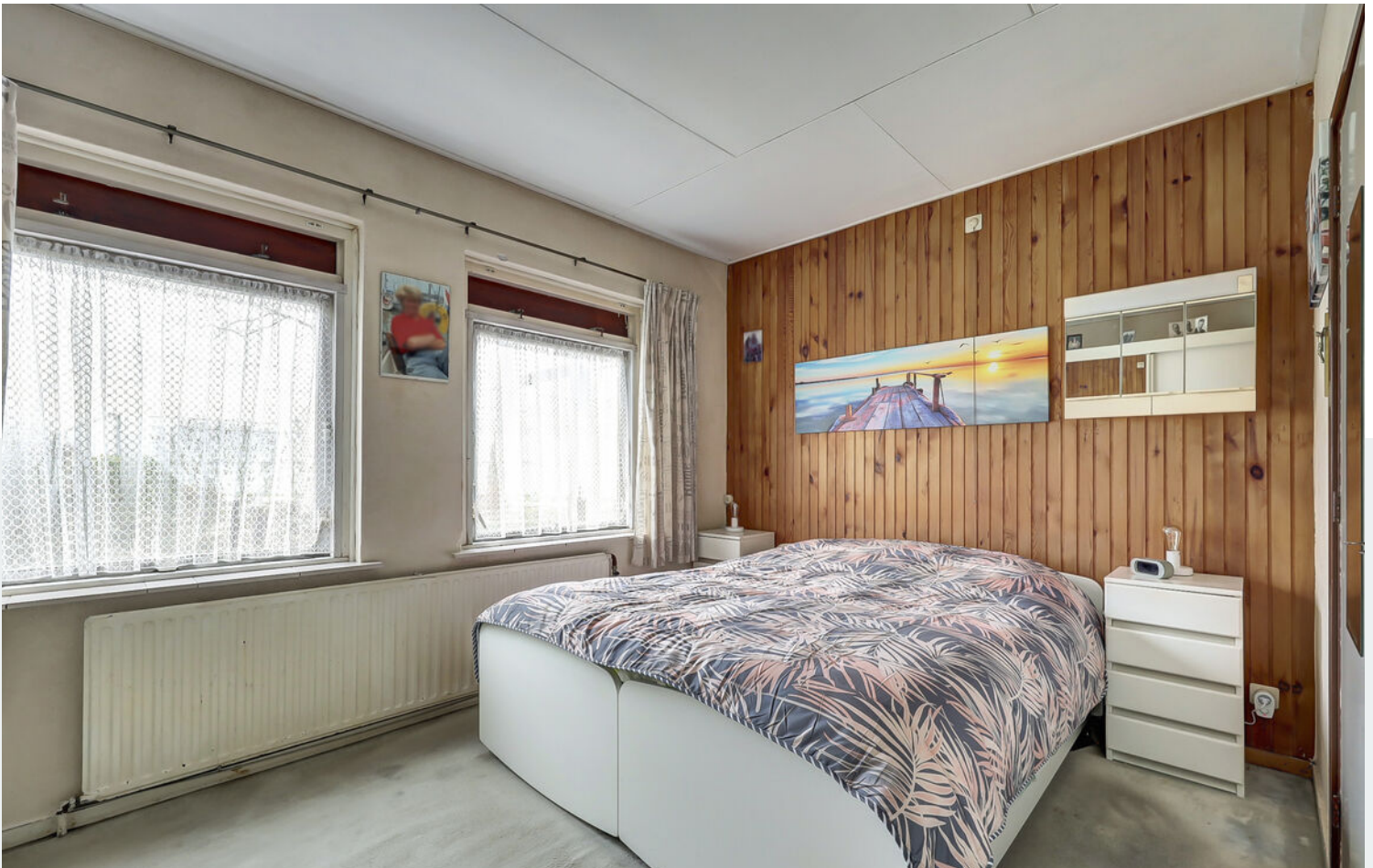
Badkamer en slaapkamers BG