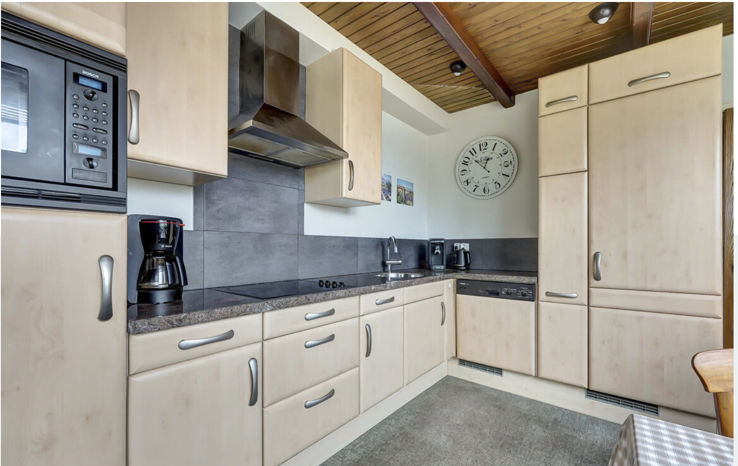
Entree, toilet en keuken