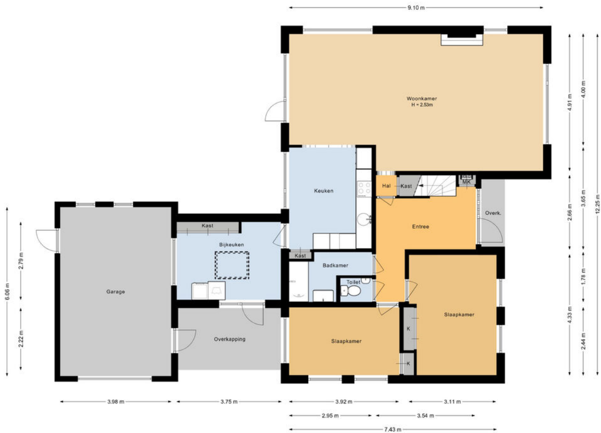
Begane grond Noord-Lierweg 18 De Lier