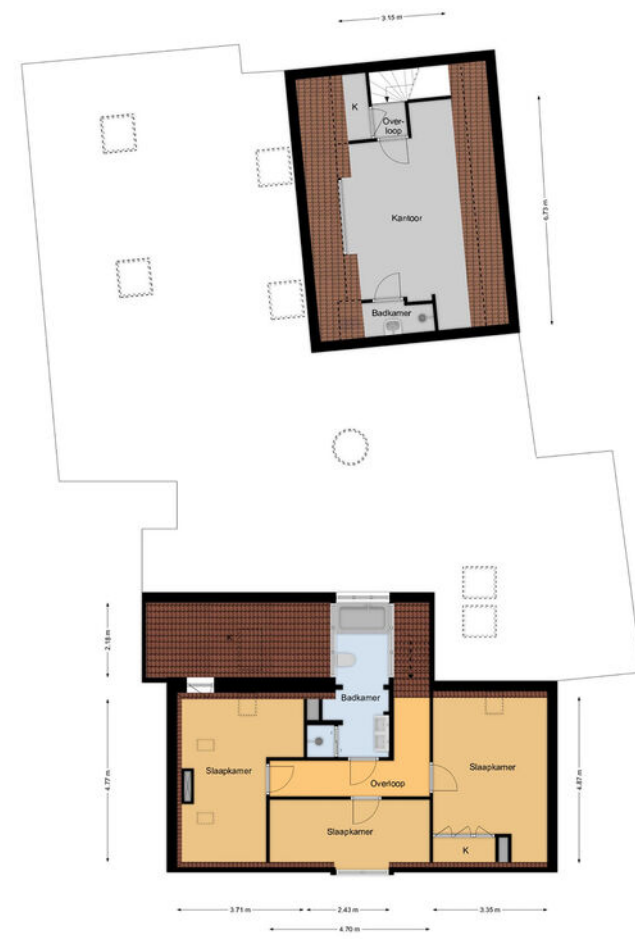
1e Verdieping Jacob Corneliszstraat 1 te Oostzaan Het gebouw is niet ter plaatse opgemeten, maar de afmetingen zijn gebaseerd op de tekeningen van de architect.