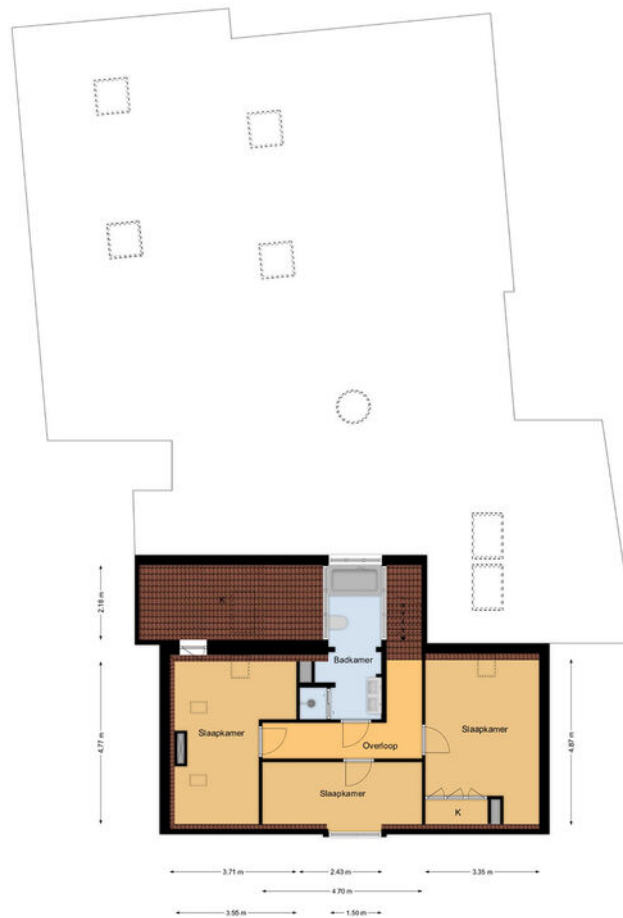
1e Verdieping Kerkbuurt 27 te Oostzaan Het gebouw is niet ter plaatse opgemeten, maar de afmetingen zijn gebaseerd op de tekeningen van de architect.