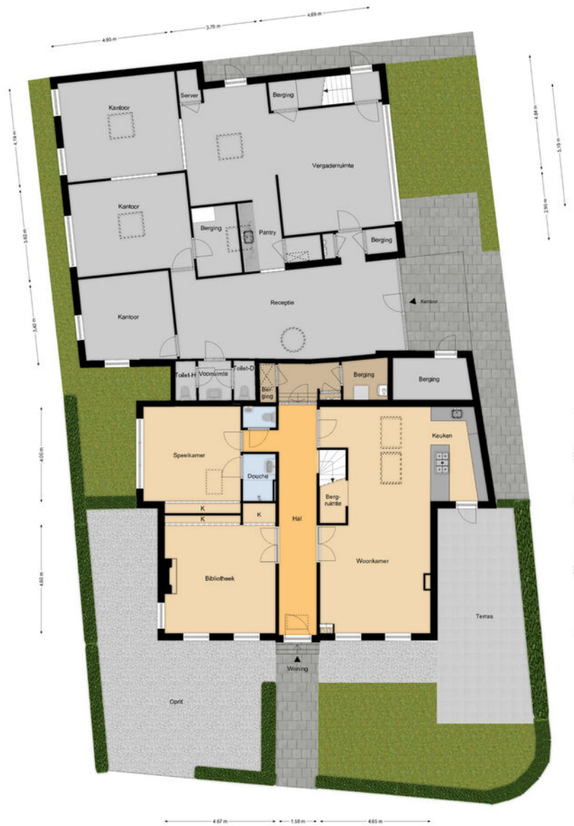
Begane grond Jacob Corneliszstraat 1 te Oostzaan Het gebouw is niet ter plaatse opgemeten, maar de afmetingen zijn gebaseerd op de tekeningen van de architect.