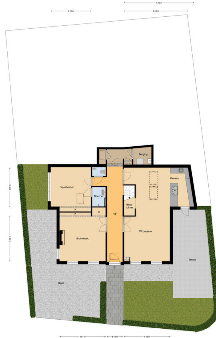
Begane grond Kerkbuurt 27 te Oostzaan Het gebouw is niet ter plaatse opgemeten, maar de afmetingen zijn gebaseerd op de tekeningen van de architect.