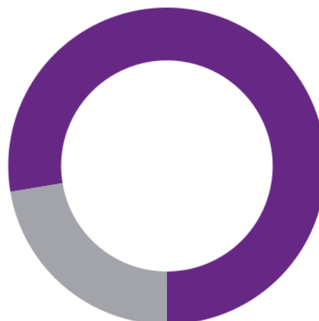
Koop / huur

0 - 14: 16% 15 - 24: 11% 25 - 44: 21% 45 - 64: 29% 65+: 23%