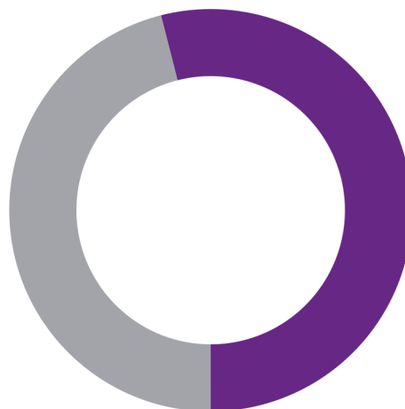
Koop / huur