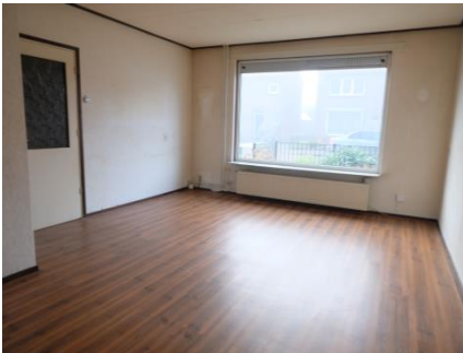
Woonkamer met zicht op de voortuin