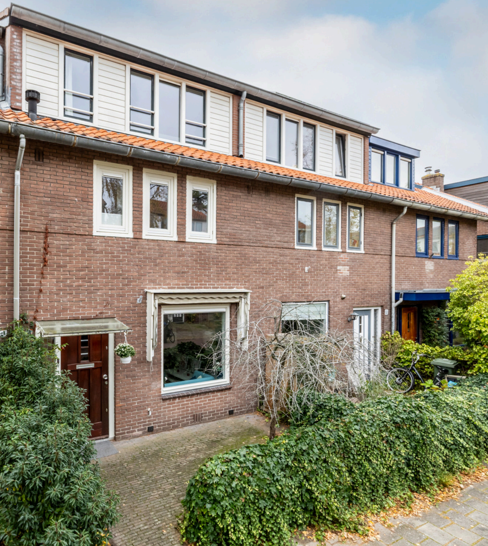
Dickmansstraat 24, Haarlem