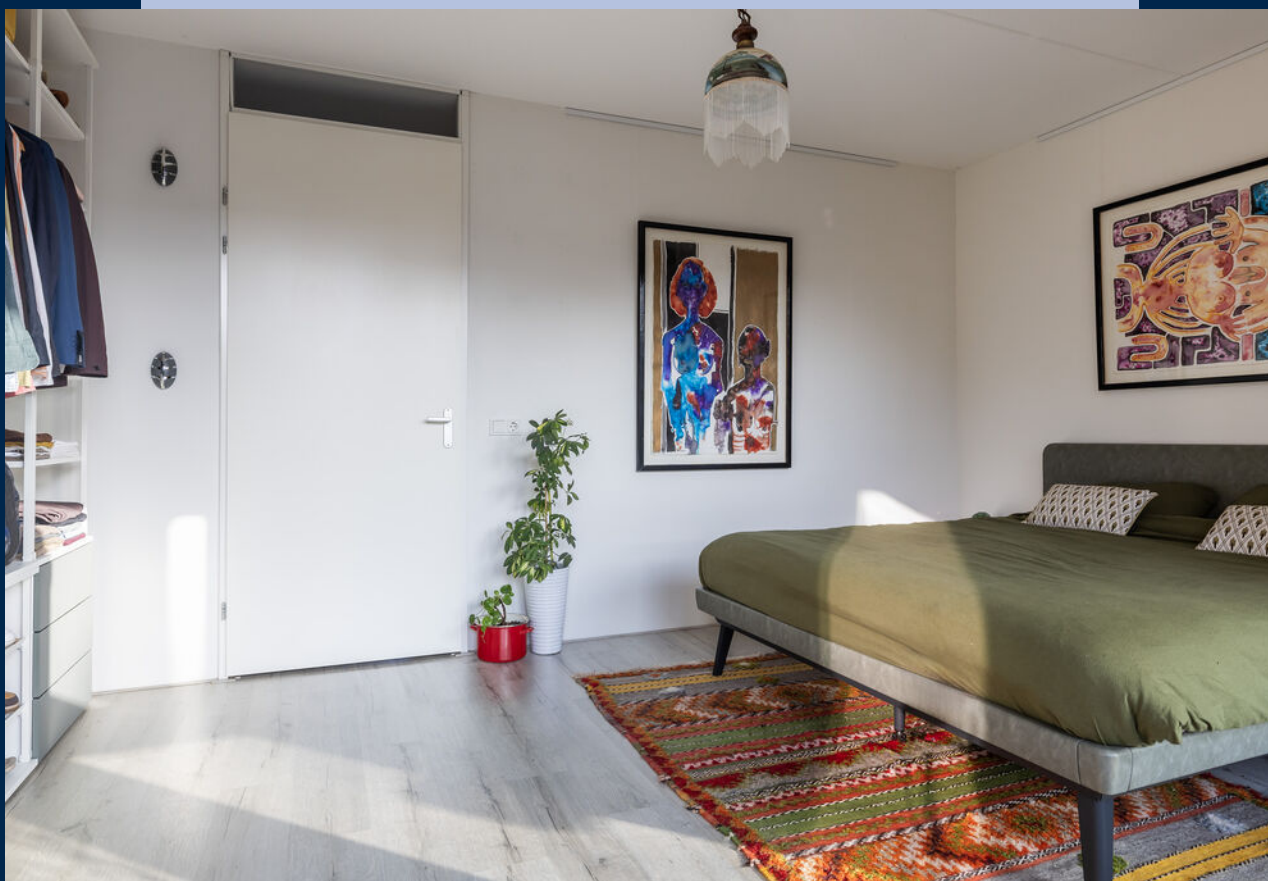
De slaapkamer is aan de achterzijde gelegen en biedt voldoende ruimte voor een tweepersoonsbed en kastruimte.