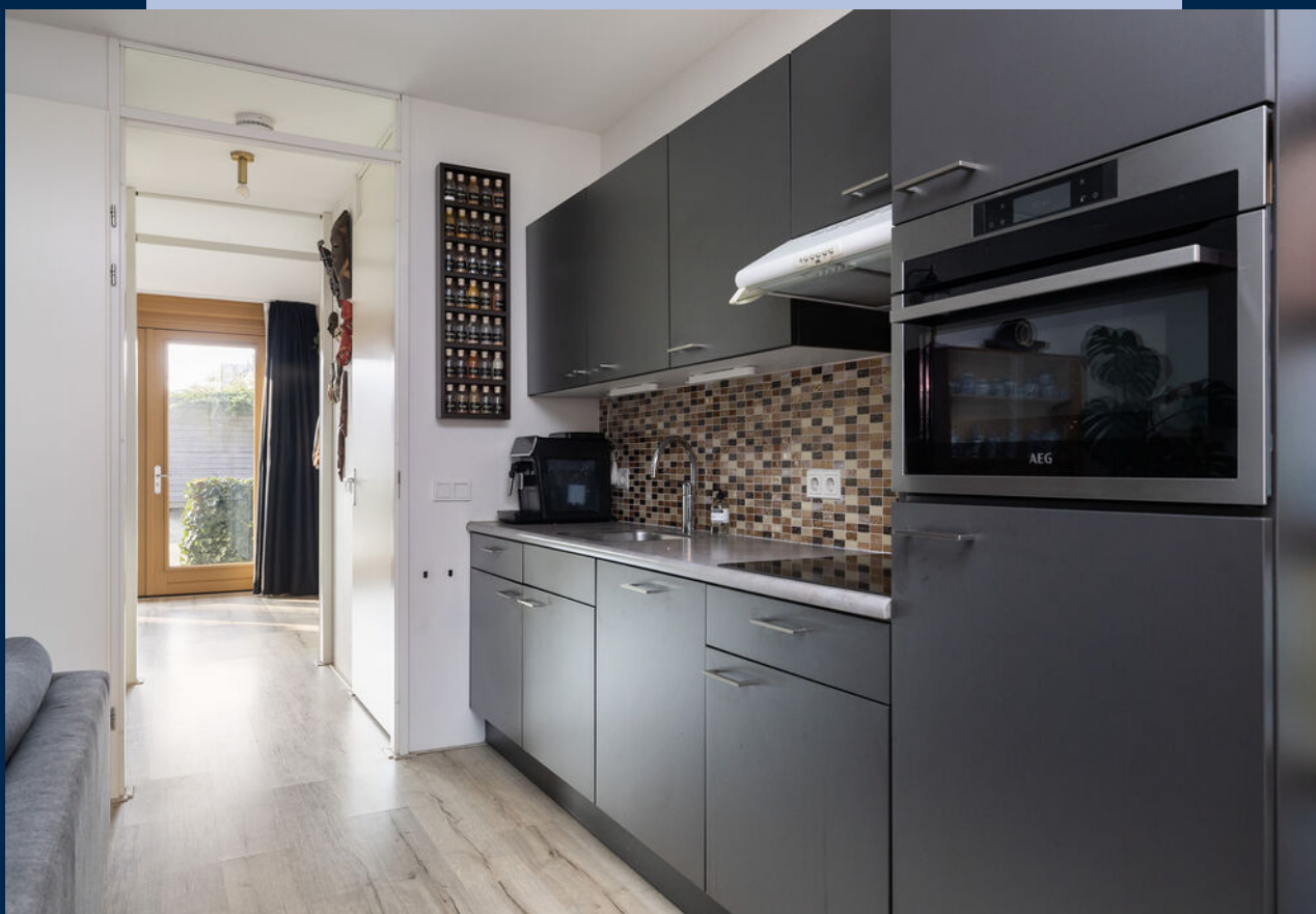
De open keuken is netjes en voorzien van diverse inbouwapparatuur, waaronder een inductiekookplaat, afzuigkap, combi-oven (2025), koelkast en vaatwasser.