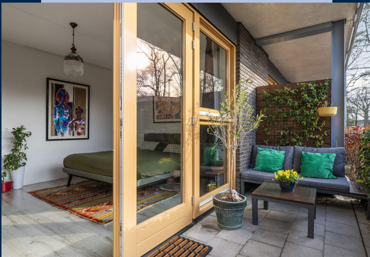
De zonnige achtertuin is gelegen op het zuiden.