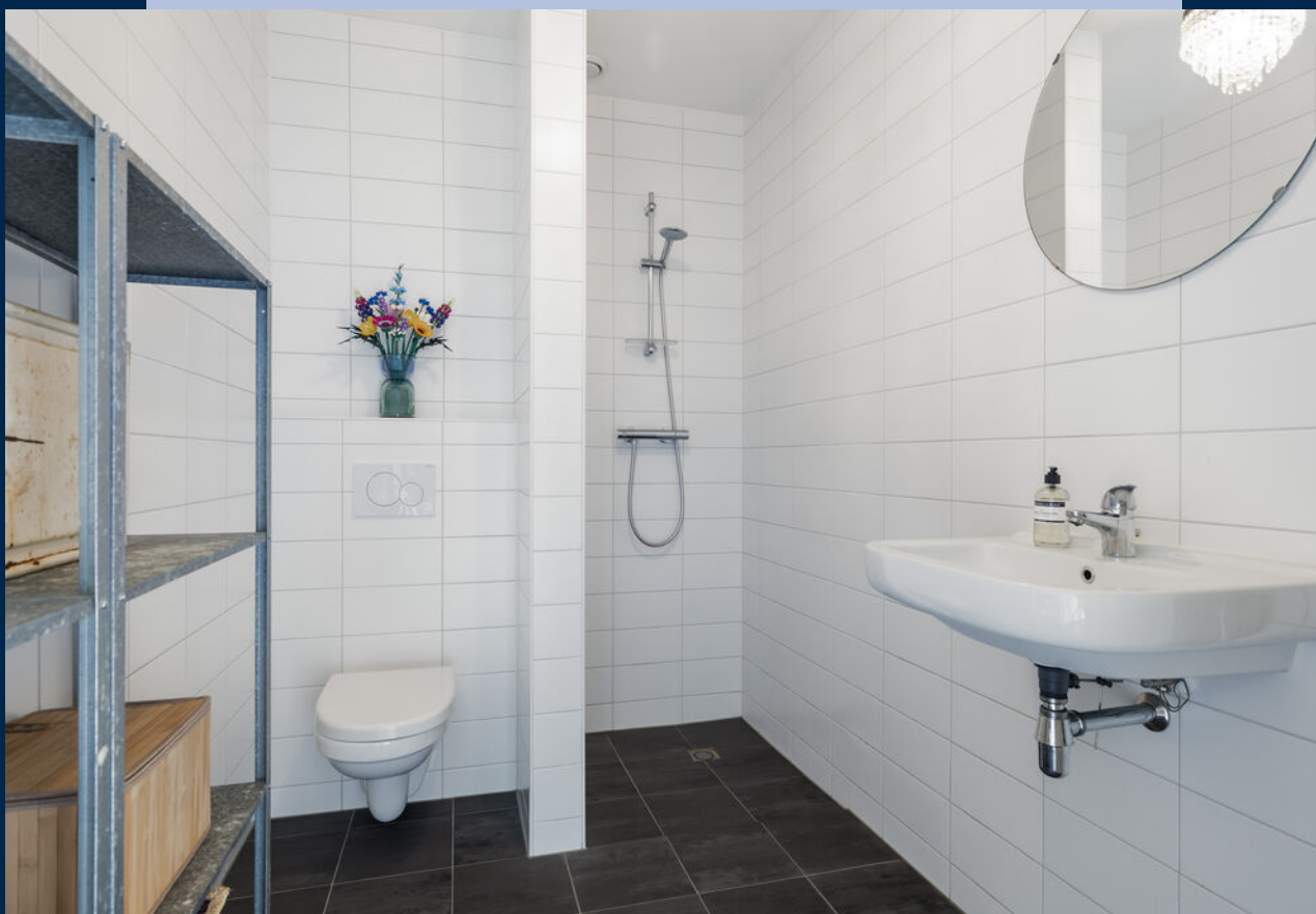
De badkamer is netjes afgewerkt en voorzien van een douche, toilet en wastafel.