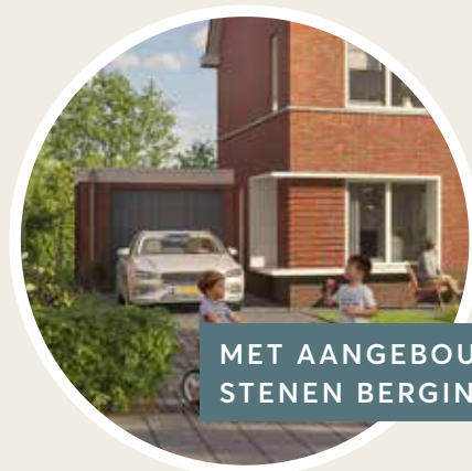
MET AANGEBOUWDE STENEN BERGING

Het aanbod in Ter Laan 4 bestaat uit acht moderne twee-onder-één-kapwoningen. De woonoppervlakte varieert van 140 - 145 m 2 . Op de volgende pagina's lees je meer over de verschillende woningtypes. Ook krijg je de kans om alle plattegronden tot in detail te bekijken. Zo kun je jouw keuze bepalen.