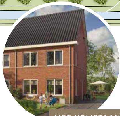
MET VRIJSTAANDE HOUTEN BERGING