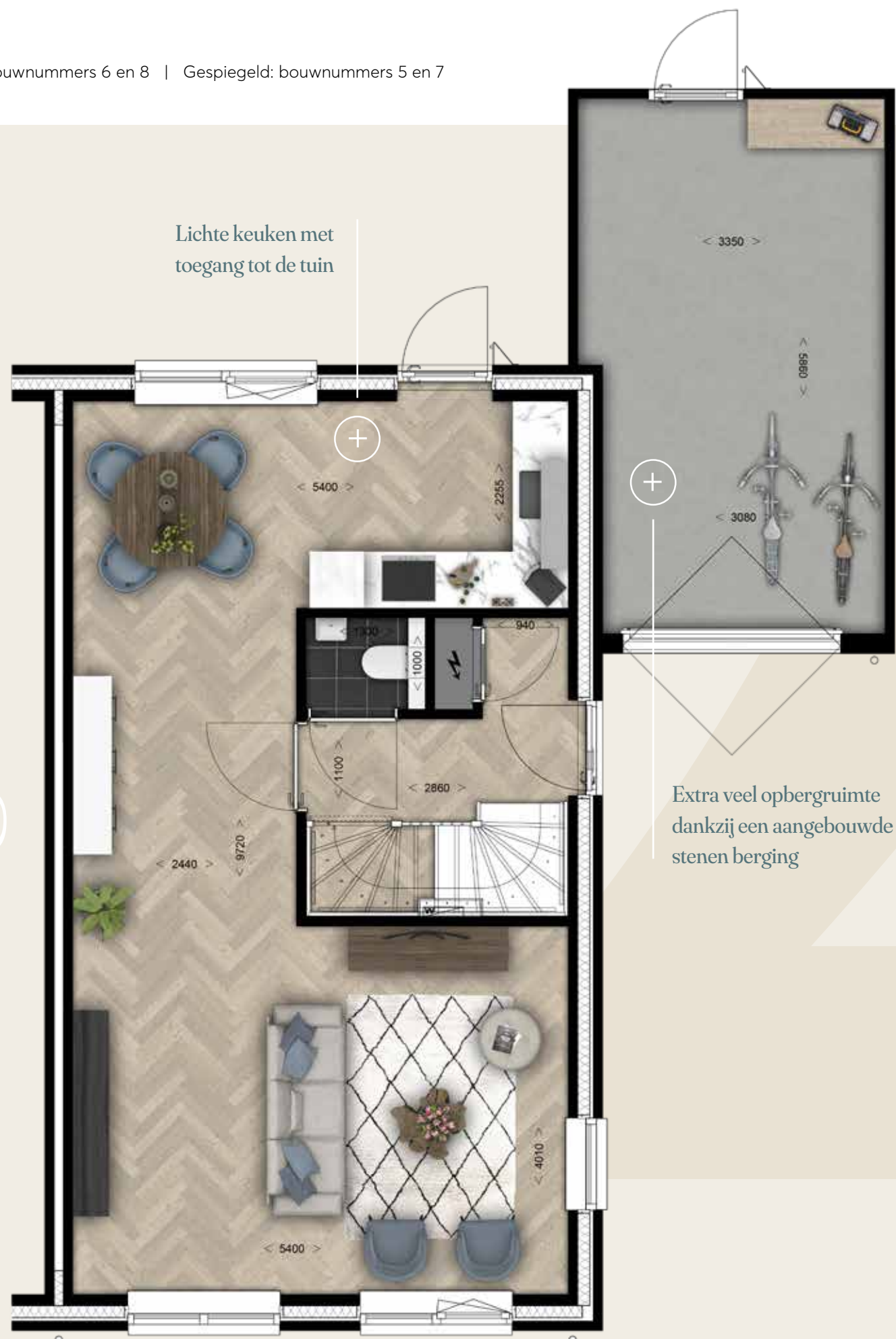
MET AANGEBOUWDE STENEN BERGING