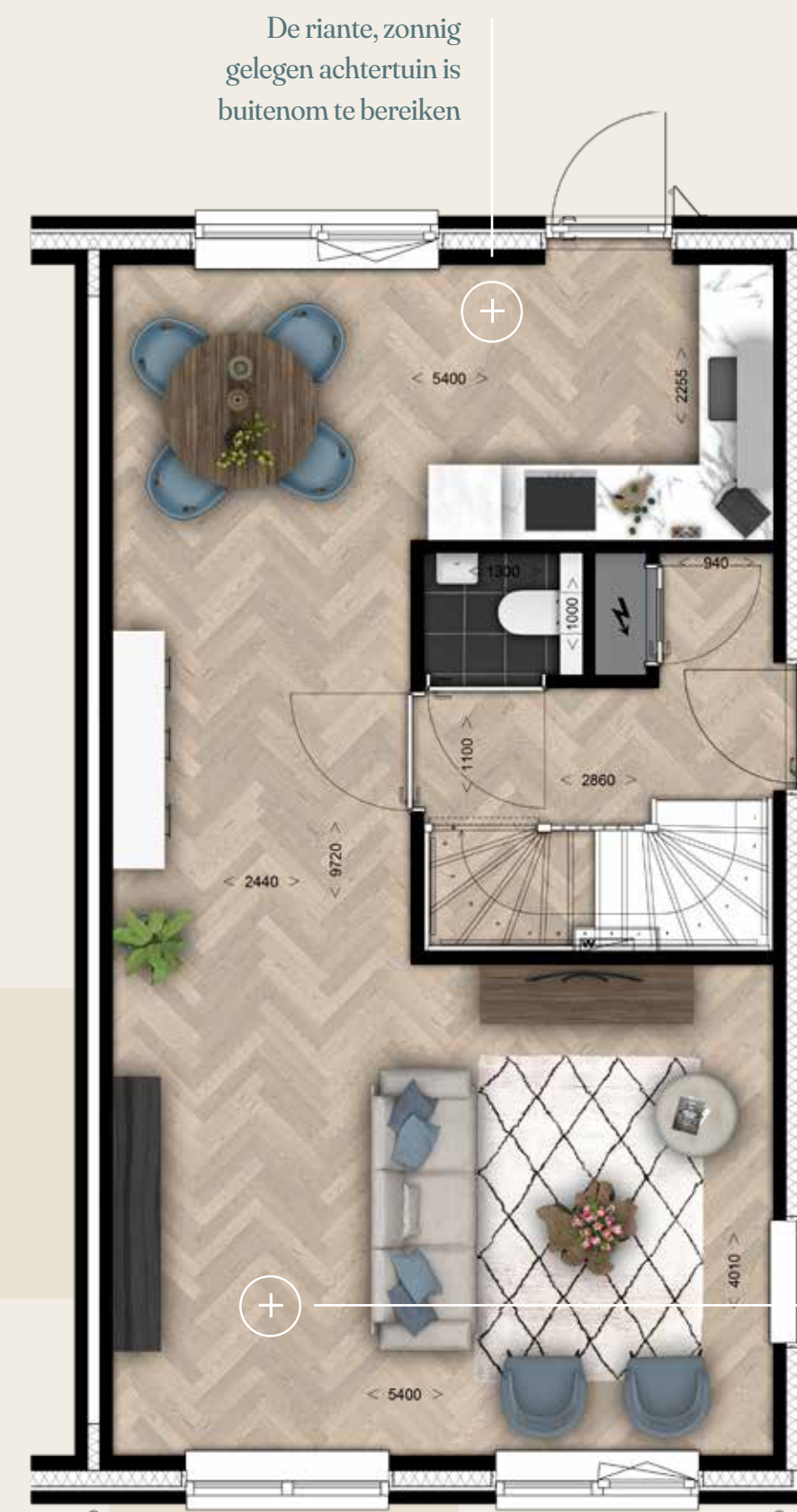
MET VRIJSTAANDE HOUTEN BERGING