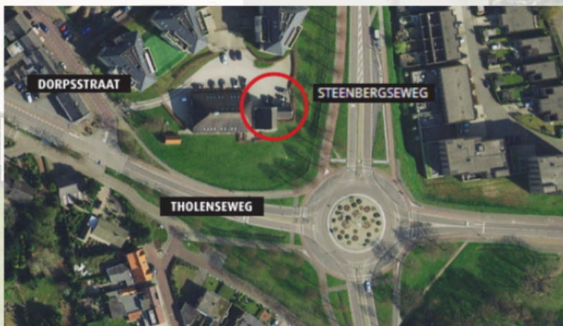
Ons kantoor bevindt zich in het woonhuis van boerderij 't Lindeke in Halsteren.