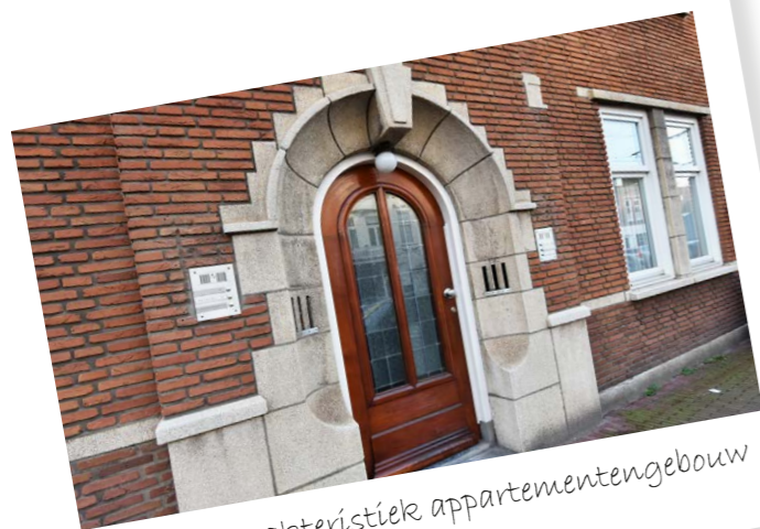
in een karakteristiek appartementengebouw

IN EEN KLEINSCHALIG EN KARAKTERISTIEK APPARTEMENTENGEBOUW, BESTAANDE UIT 6 APPARTEMENTEN, GELEGEN GOED ONDERHOUDEN EN RUIME VOORMALIGE VIERKAMER BENEDENWONING MET FRAAIE ACHTERTUIN OP HET ZUIDWESTEN MET BERGING, ACHTERUITGANG EN BERGING IN HET ACHTERGELEGEN PAD. DE WONING IS GELEGEN OP EIGEN GROND EN OP LOOPAFSTAND VAN DE WINKELS AAN DE KEIZERSTRAAT EN BADHUISSTRAAT, DE BOULEVARD EN HET STRAND VAN SCHEVENINGEN-BAD.