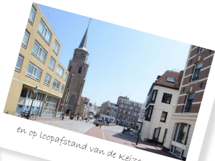
en op loopafstand van de Keizerstraat