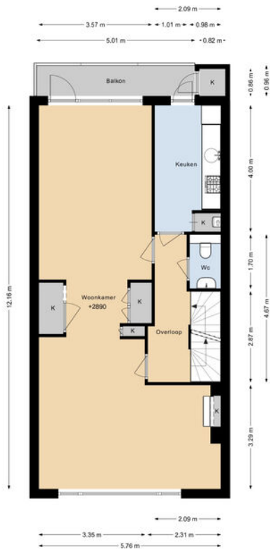
VAN ALKEMADELAAN 303 1E VERDIEPING

DEZE PLATTEGRONDEN ZIJN MET DE GROOTSTE ZORG SAMENGESTELD EN DIENEN TER INDICATIE. ER KUNNEN GEEN RECHTEN AAN WORDEN ONTLEEND.