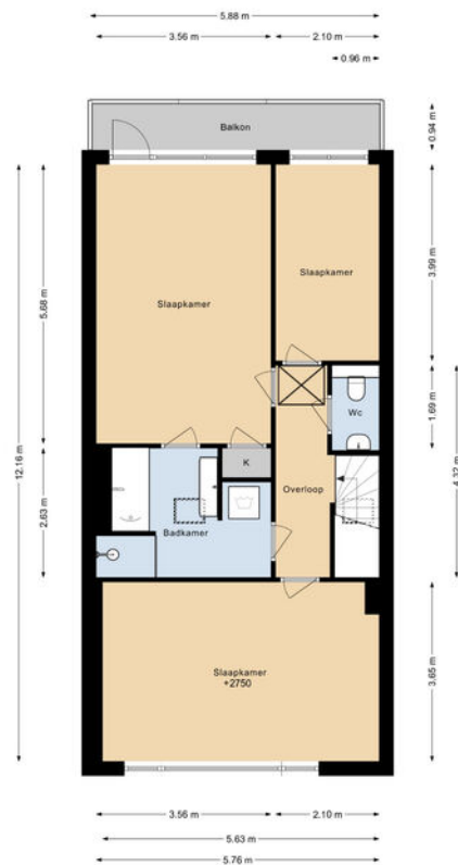
VAN ALKEMADELAAN 303 2E VERDIEPING

DEZE PLATTEGRONDEN ZIJN MET DE GROOTSTE ZORG SAMENGESTELD EN DIENEN TER INDICATIE. ER KUNNEN GEEN RECHTEN AAN WORDEN ONTLEEND. © WWW.DROOMHUIS360.NL