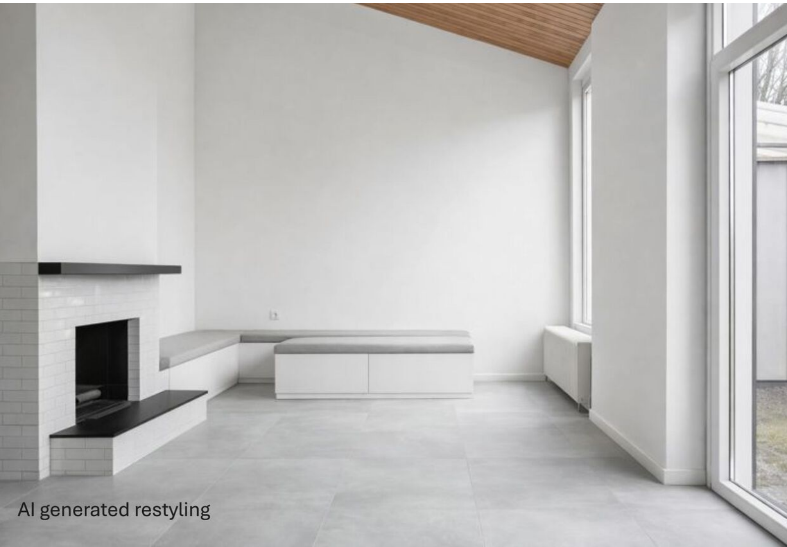
AI generated restyling