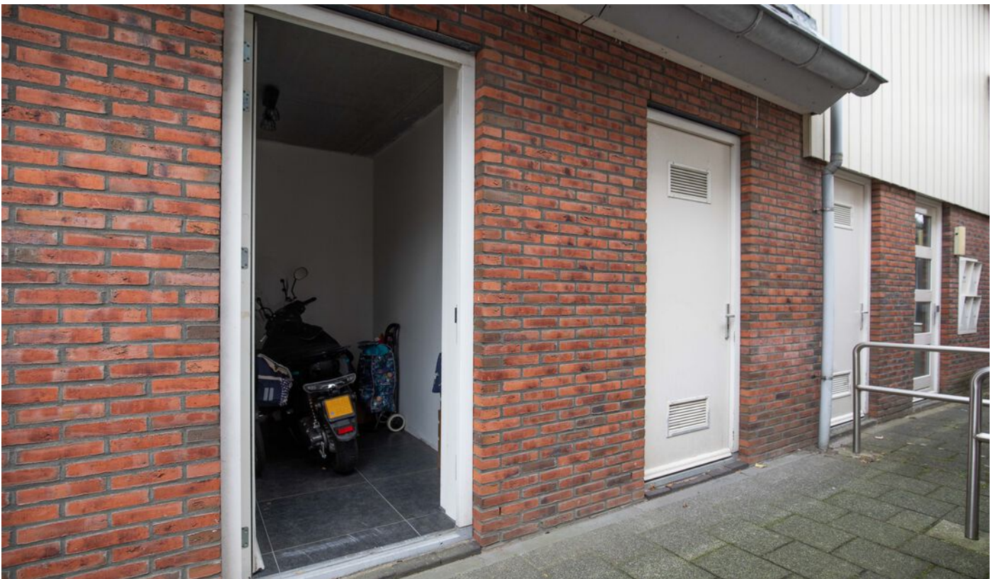
Entree en berging