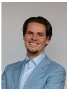
Yme Koevoet Makelaar o.z.

Als lokale experts kennen wij de regio Leiden van binnen en buiten. U kunt bij ons terecht voor al uw vragen en advies met betrekking tot onroerend goed. Wij zijn een servicegerichte organisatie en ondersteunen u bij elke stap van het transactieproces. Van tips om uw huis verkoopklaar te maken tot aan het verzorgen van een naamplaatje voor de nieuwe eigenaar van uw woning. Onze beroemde slogan luidt: "Niemand in de wereld verkoopt meer onroerend goed dan RE/MAX." Laat ons u overtuigen.