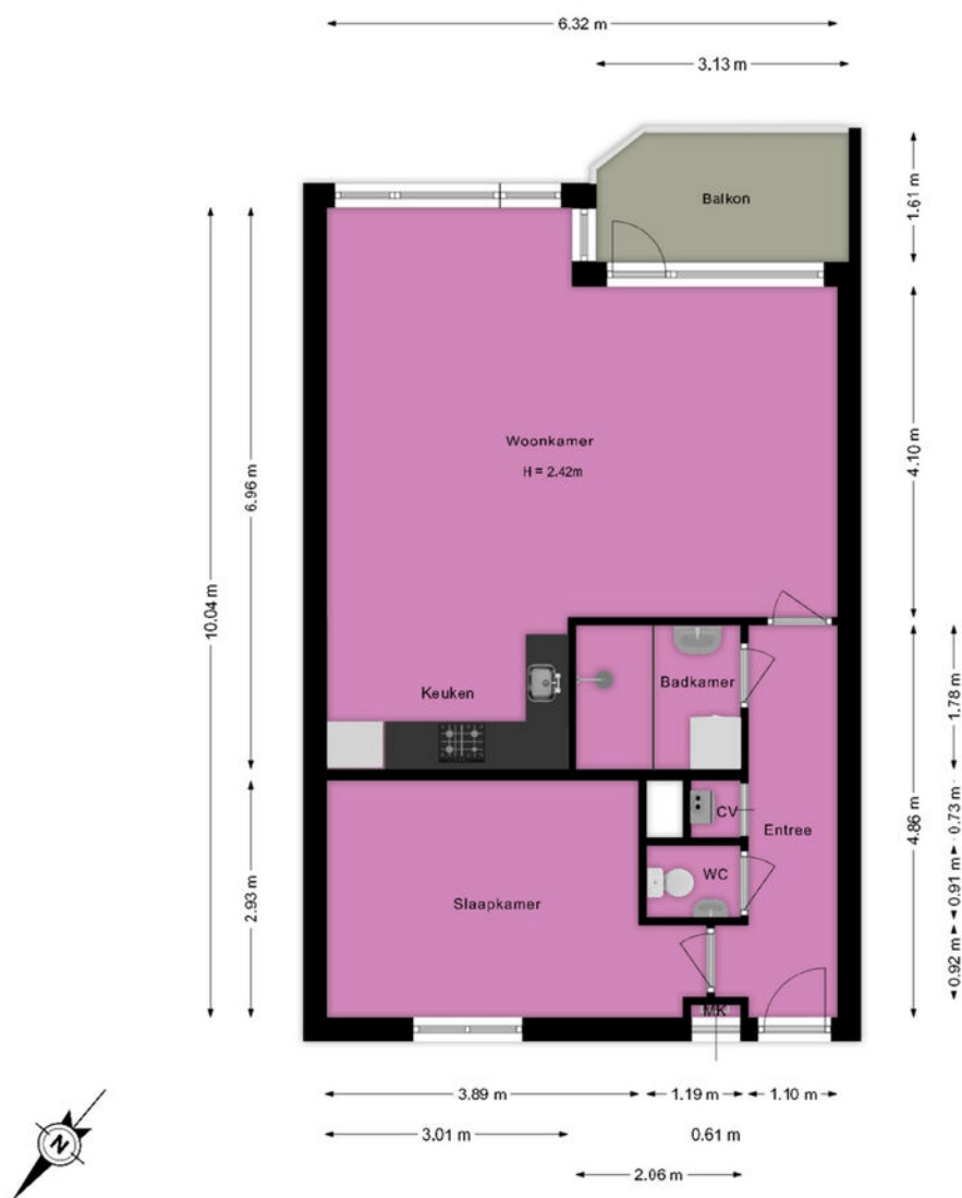
Beatrixstraat 11 Voorhout Appartement

Deze plattegrond is met de grootst mogelijke zorg samengesteld. Desondanks kunnen er geen rechten aan worden ontleend en kunnen er kleine afwijking zijn in de exacte maatvoering. www.agvastgoedmedia.nl