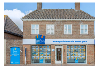
Vlijmen Plein 7a 073 - 511 70 00 infovlijmen@staete.nl