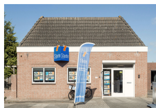
Drunen Achterstraat 14a 0416 - 376 141 infodrunen@staete.nl