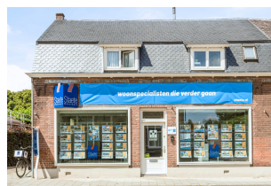
Sint-Michiëlsgestel Nieuwstraat 41a 073 - 551 00 50 infogestel@staete.nl