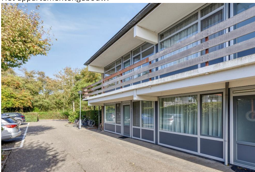
Het appartementengebouw met eigen parkeerplaats.