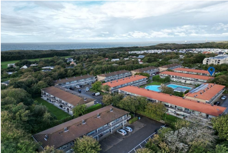
Luchtopname met de unieke ligging van het appartement.