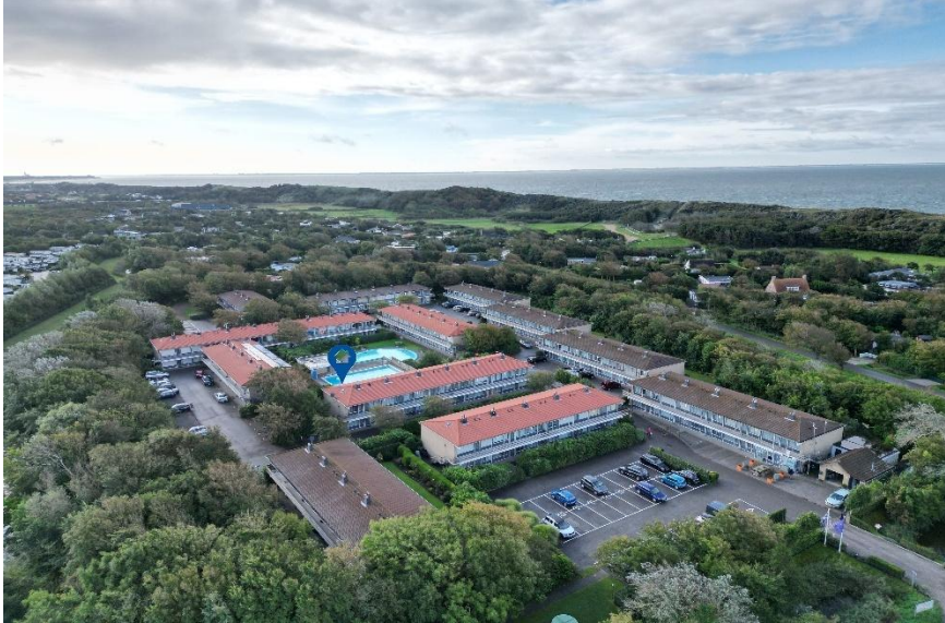
Luchtopname met ligging appartement met de zee op de achtergrond!