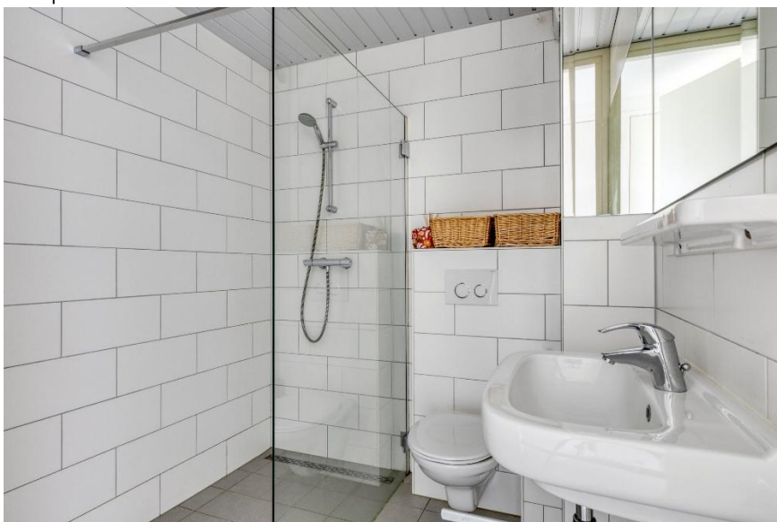
De nette badkamer met wastafel, toilet en inloopdouche.

Verkoopbrochure: Duinweg 102 Westkapelle Deze informatie is geheel vrijblijvend, uitsluitend bestemd voor geadresseerde en niet bedoeld als een aanbod. Ten aanzien van de juistheid kan door Makelaarskantoor Roose geen aansprakelijkheid worden aanvaard, noch kan aan de vermelde informatie enig recht worden ontleend.