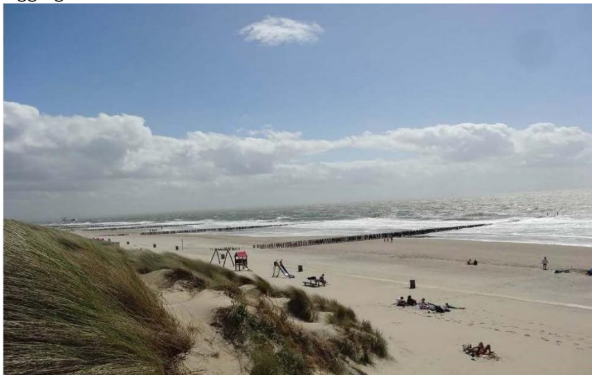
Op enkele minuten lopen van het strand.