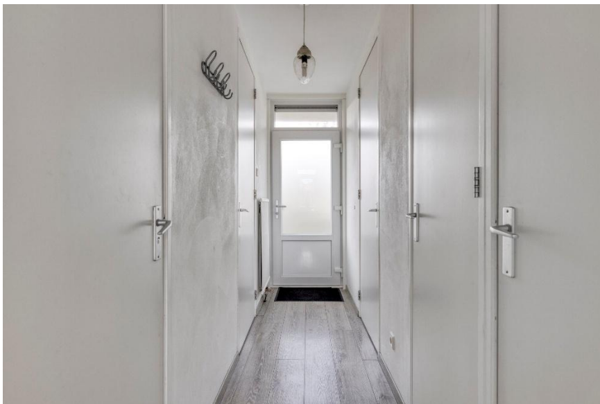
De entree met toegang naar de slaapkamers en de badkamer.