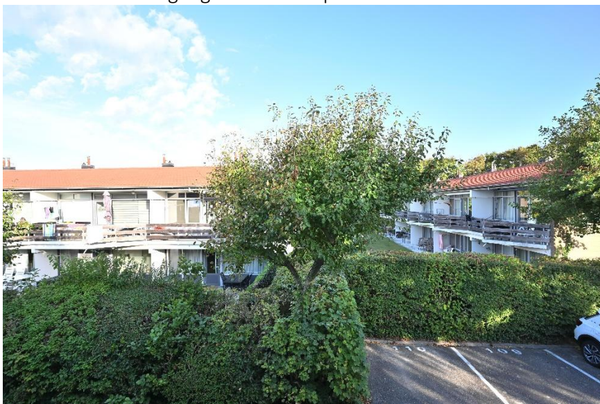
Uitzicht vanuit o.a. de entree.

Verkoopbrochure: Duinweg 102 Westkapelle Deze informatie is geheel vrijblijvend, uitsluitend bestemd voor geadresseerde en niet bedoeld als een aanbod. Ten aanzien van de juistheid kan door Makelaarskantoor Roose geen aansprakelijkheid worden aanvaard, noch kan aan de vermelde informatie enig recht worden ontleend.