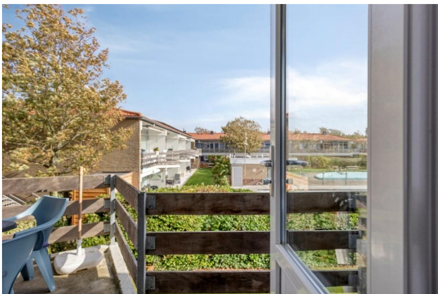
Toegang naar het balkon vanuit de woonkamer.

Verkoopbrochure: Duinweg 102 Westkapelle Deze informatie is geheel vrijblijvend, uitsluitend bestemd voor geadresseerde en niet bedoeld als een aanbod. Ten aanzien van de juistheid kan door Makelaarskantoor Roose geen aansprakelijkheid worden aanvaard, noch kan aan de vermelde informatie enig recht worden ontleend.