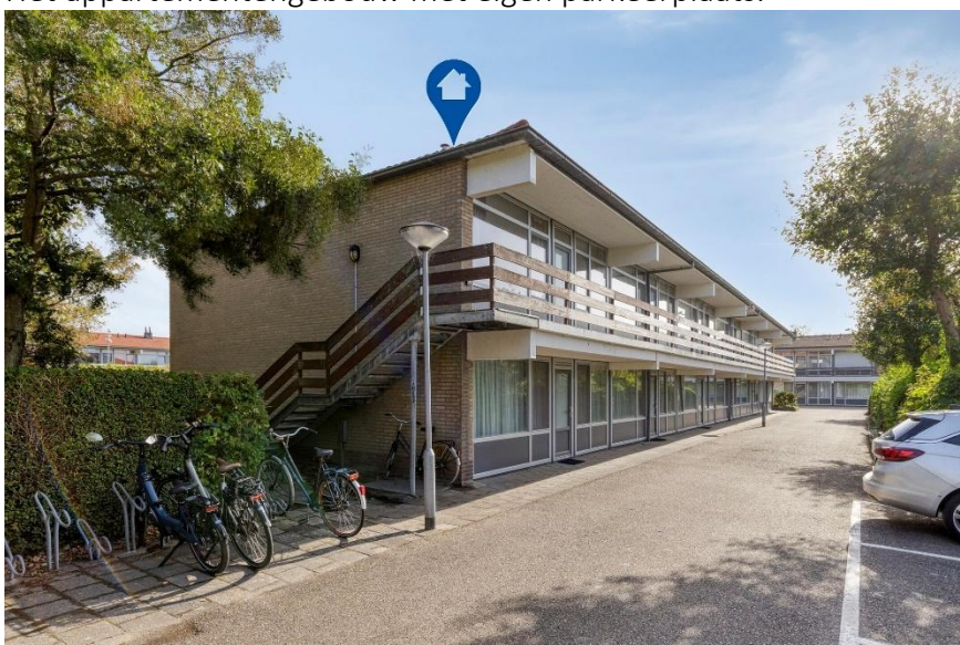
Voor-zijaanzicht van het appartementengebouw.

Verkoopbrochure: Duinweg 102 Westkapelle Deze informatie is geheel vrijblijvend, uitsluitend bestemd voor geadresseerde en niet bedoeld als een aanbod. Ten aanzien van de juistheid kan door Makelaarskantoor Roose geen aansprakelijkheid worden aanvaard, noch kan aan de vermelde informatie enig recht worden ontleend.