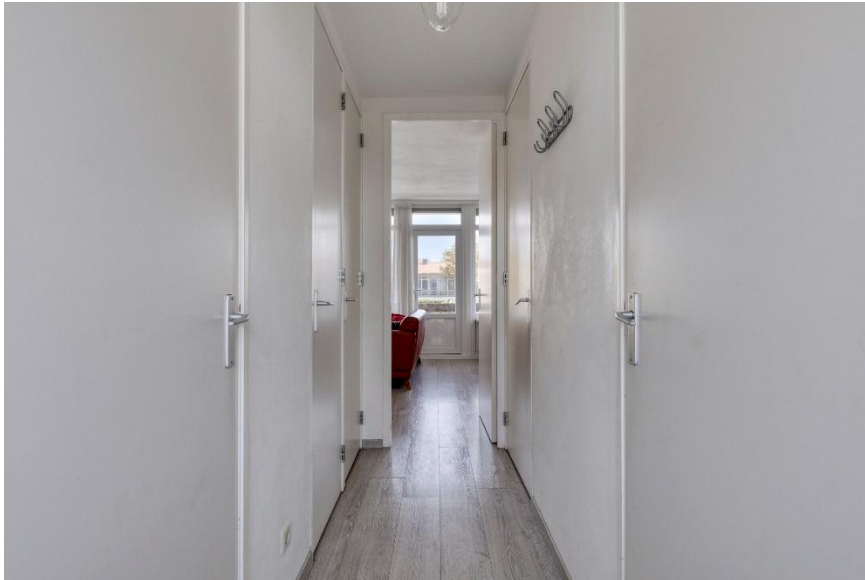
Welkom in de entree.