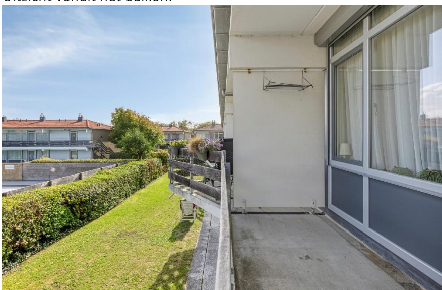
Uitzicht vanuit het balkon.