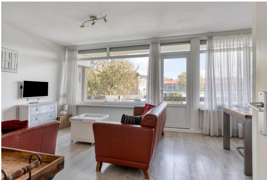
De lichte woonkamer.