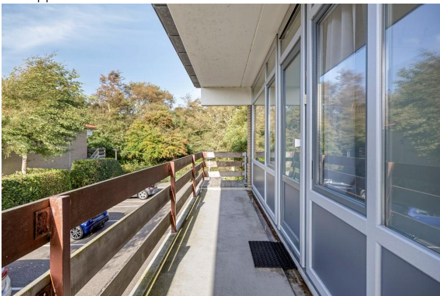
Toegang tot de entree.

Verkoopbrochure: Duinweg 102 Westkapelle Deze informatie is geheel vrijblijvend, uitsluitend bestemd voor geadresseerde en niet bedoeld als een aanbod. Ten aanzien van de juistheid kan door Makelaarskantoor Roose geen aansprakelijkheid worden aanvaard, noch kan aan de vermelde informatie enig recht worden ontleend.