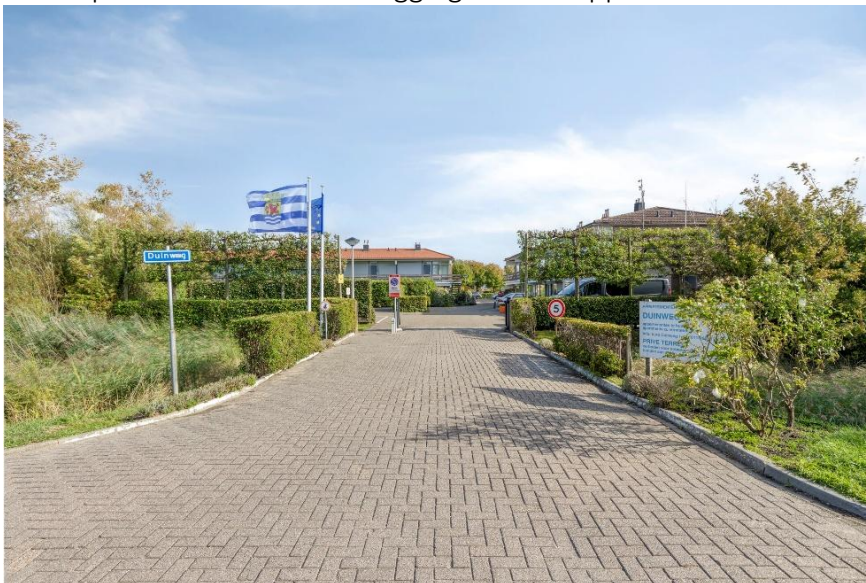
Binnenkomst in het appartementencomplex Duinweg met een afsluitbaar hekwerk.

Verkoopbrochure: Duinweg 102 Westkapelle Deze informatie is geheel vrijblijvend, uitsluitend bestemd voor geadresseerde en niet bedoeld als een aanbod. Ten aanzien van de juistheid kan door Makelaarskantoor Roose geen aansprakelijkheid worden aanvaard, noch kan aan de vermelde informatie enig recht worden ontleend.