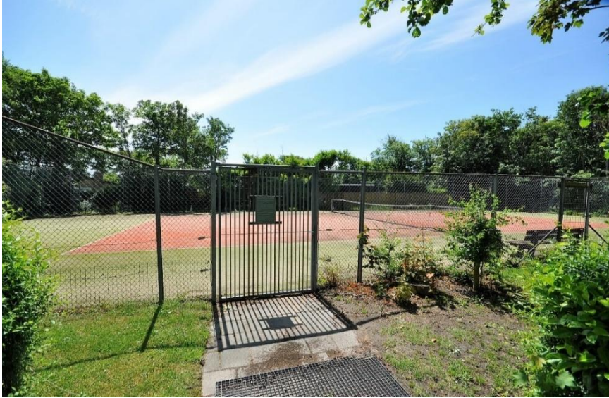
Tennisbaan op het appartementencomplex.