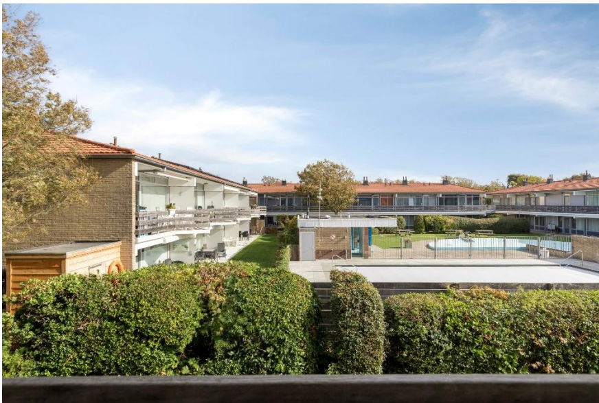
Uitzicht vanuit het balkon.

Verkoopbrochure: Duinweg 102 Westkapelle Deze informatie is geheel vrijblijvend, uitsluitend bestemd voor geadresseerde en niet bedoeld als een aanbod. Ten aanzien van de juistheid kan door Makelaarskantoor Roose geen aansprakelijkheid worden aanvaard, noch kan aan de vermelde informatie enig recht worden ontleend.