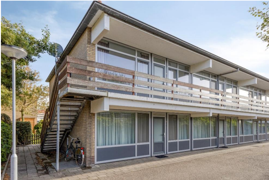
Voor-zijaanzicht van het appartementengebouw.