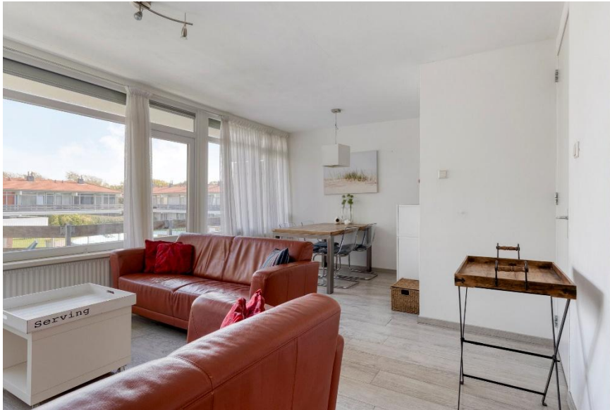
De woonkamer met deur naar het balkon op het zuidoosten.