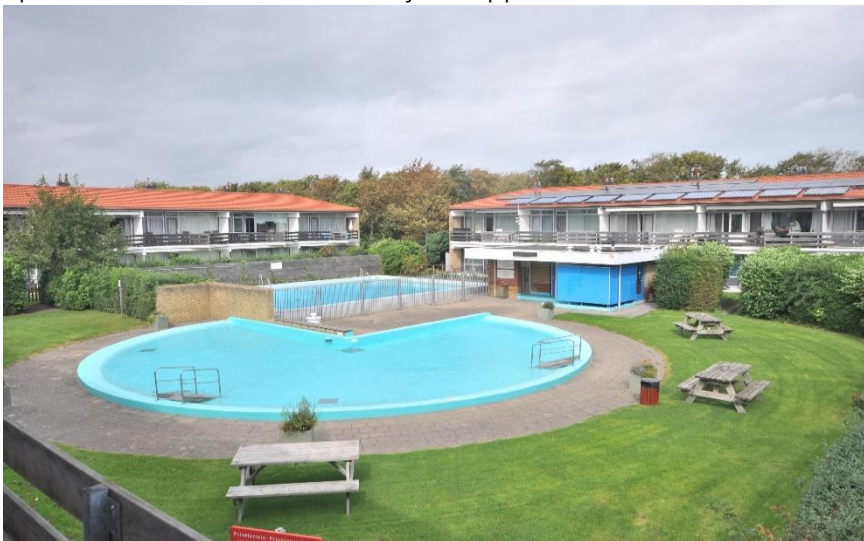
Met een verwarmd buitenzwembad dichtbij het hoekappartement.

Verkoopbrochure: Duinweg 102 Westkapelle Deze informatie is geheel vrijblijvend, uitsluitend bestemd voor geadresseerde en niet bedoeld als een aanbod. Ten aanzien van de juistheid kan door Makelaarskantoor Roose geen aansprakelijkheid worden aanvaard, noch kan aan de vermelde informatie enig recht worden ontleend.