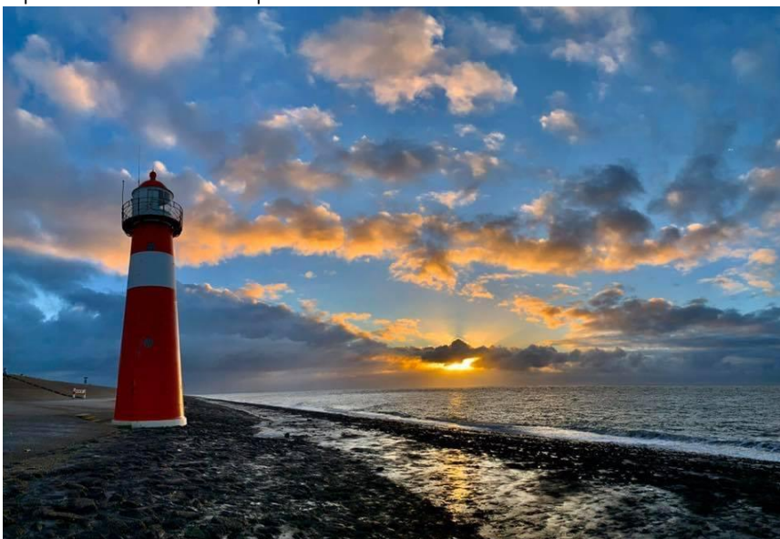
Op loopafstand van dit prachtige uitzicht.

Verkoopbrochure: Duinweg 102 Westkapelle Deze informatie is geheel vrijblijvend, uitsluitend bestemd voor geadresseerde en niet bedoeld als een aanbod. Ten aanzien van de juistheid kan door Makelaarskantoor Roose geen aansprakelijkheid worden aanvaard, noch kan aan de vermelde informatie enig recht worden ontleend.