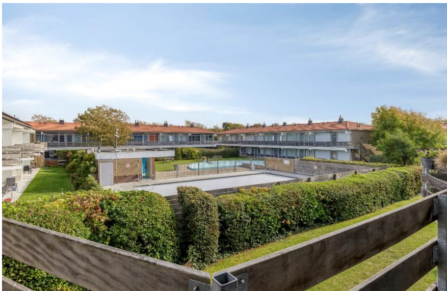
Uitzicht vanuit het balkon.