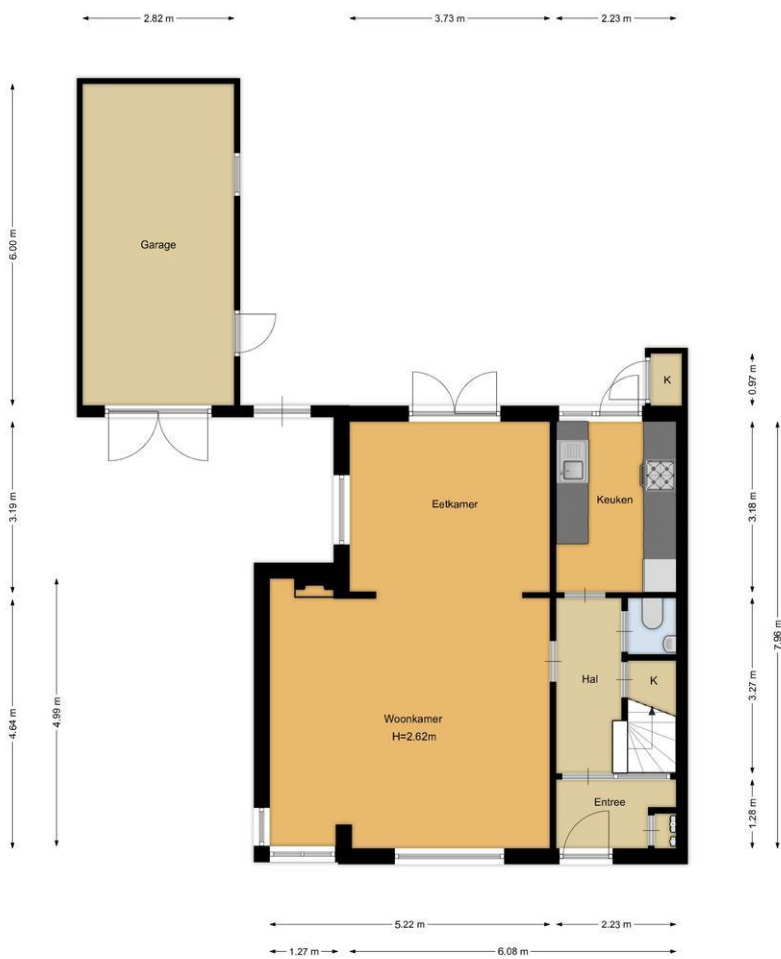
Heemskerklaan 27, Naarden Begane grond

De plattegronden zijn geproduceerd voor promotionele doeleinden en ter indicatie. Aan de plattegronden kunnen geen rechten worden ontleend.