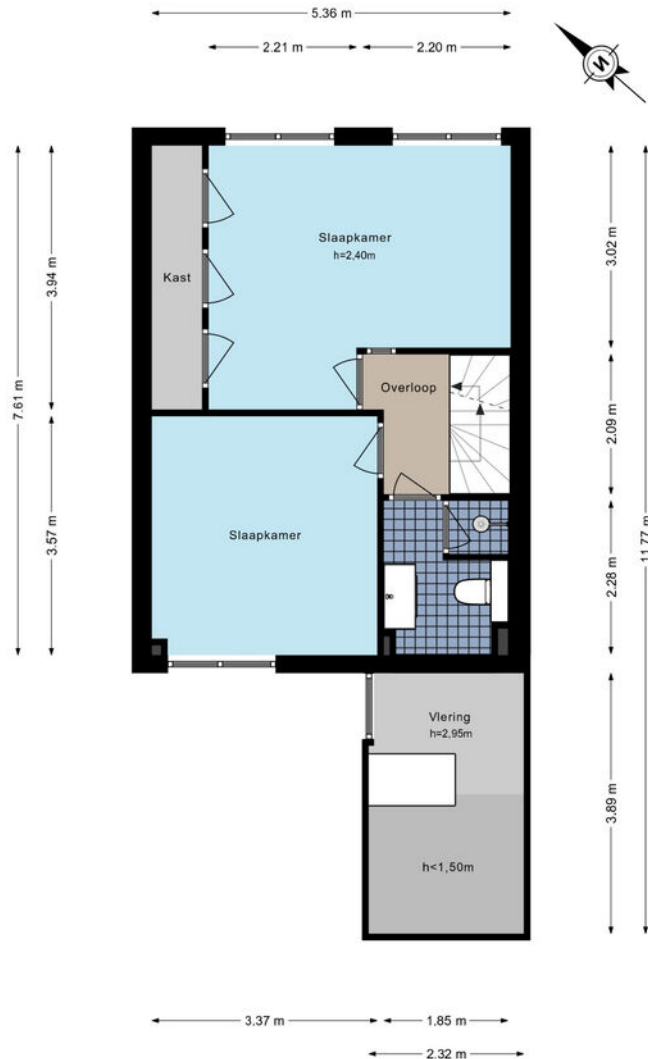
Lorentzhof 24 - Kudelstaart Eerste verdieping